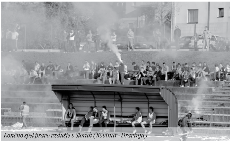
Končno spet pravo vzdušje v Štorah (Kovinar - Dravinja)