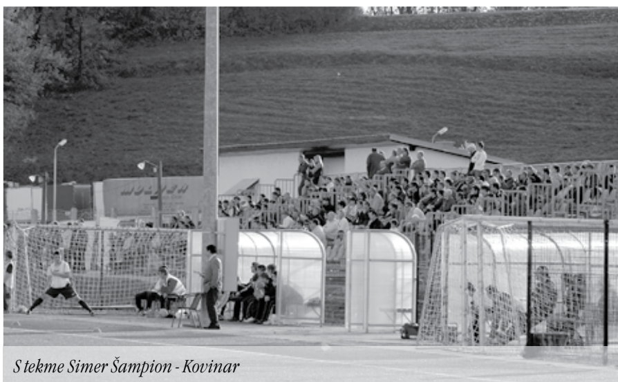
Stekme Simer Šampion - Kovinar