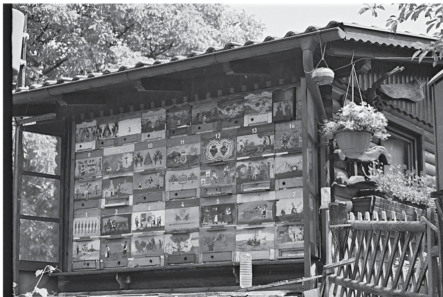
Blagotinškov čebelnjak v Jagočah

aktivnosti in strokovno obdelane dediščine ter pripravljenih posameznih projektov revitalizacije omogočiti vključitev dediščine v dopolnilne ali osnovne dejavnosti na podeželju znotraj območja LAS.