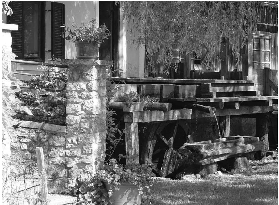
Soržev mlin v Polžah

1. projekt z naslovom Kraške jame na območju občin Celje, Laško, Štore in Vojnik, katerega nosilec je koroško-šaleški jamarski klub 'Speleos-Siga' Velenje. Na območju občin je registriranih 26 kraških jam. Vse so naravne vrednote državnega pomena. Nekatere med njimi ležijo znotraj ekološko pomembnih območij, Nature 2000 ter znotraj vodovarstvenih območij. Jame bodo ponovno raziskali, dokumentirali, določili njihovo lego. Natančno določene lege vhodov jam in podatki o jamah bodo koristile upravljalcem vodnih virov, izdelovalcem tematskih pohodnih, kolesarskih, učnih in drugih poti, upravljavcem naravnih vrednot, turističnim ponudnikom. Grožnja na poti trajnostnega razvoja ter zdravega in kvalitetnega življenja posameznika so tudi divja odlagališča odpadkov v kraških jamah, ki predstavljajo grožnjo virom pitne vode. Vzpostavili bodo digitalni kataster divjih odlagališč