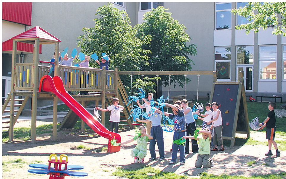
Otroci so se igral zelo razveselili in ob otvoritvi pripravili priložnostni program in razstavo.