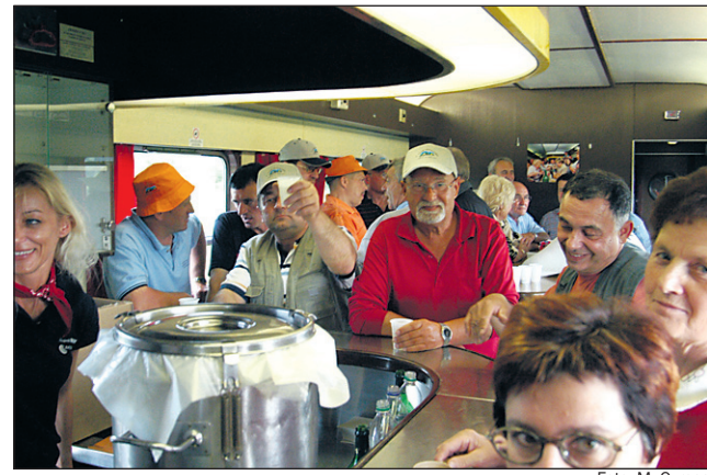
Najbolj obiskan in razigran vagon je bil zagotovo tisti s kavico in bifejem.

V imenu vseh udeležencev 3. Vlaka zvestobe hvala vsem, ki so skrbeli za našo dobro voljo, še posebej Ptujskim pekarjem in slaščičarnam, Restavraciji Gastro, Turistični kmetiji Puklavec in Drauskim elektrarnam Maribor, ki so poskrbeli tudi za to, da med potjo nismo bili lačni in žejni!