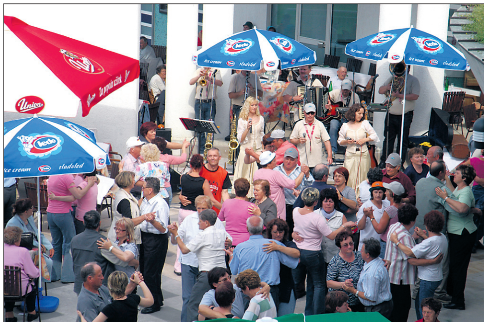
Po kosilu, slastni torti z refoškom ali malvazijo so mnogi veselo zaplesali.