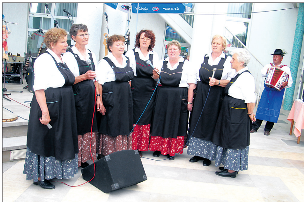
Vesele Urbančanke s frajtonarjem so zapele in zaigrale tudi pred hotelom Delfin v Izoli.