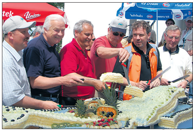
Torto, darilo hotela Delfin, so razrezali župani, podžupani in poslanec iz Spodnjega Podravja.