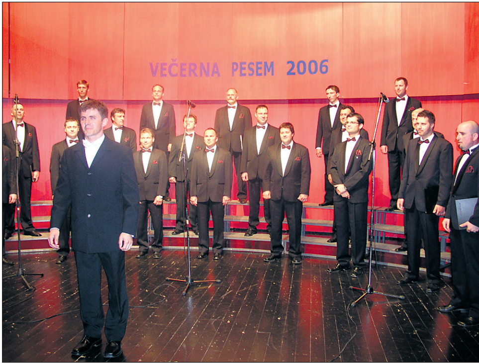
Komorni moški zbor Ptuj se je predstavil z novim zborovodjem