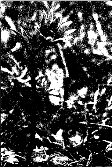
Sl. 2: Zvezdasta vetrnica Anemone hortensis

b) zelnate: Allium montanum , Anemone hortensis (sl. 2), Campanula pyramidalis , Cleistogenes serotina , Gagea pusilla (Kaligarič, 1987b: 21), Dictamnus albus , Odontites lutea , Orchis papilionacea , Potentilla tommasiniana , Scilla autumnalis , Thymelaea passerina (Jogan & T. Wraber, 1990: 317).