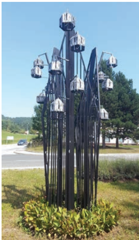
Slika 7: Solzica velikanka