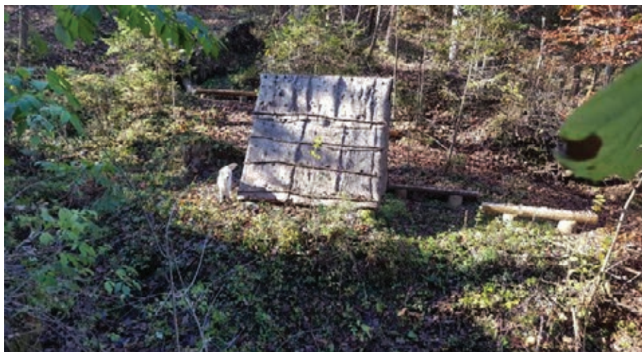
Slika 4: Pogled pred jamo Pekel

in neprijazen, da se je človeku, ki je vstopil vanj, nehote stisnilo srce. Edino, kar je bilo v njem živega, je bil studenec, ki je izviral prav na njegovem dnu, izpod mahovnatih skal ter po kratki vijugasti dragici izginjal skozi temno žrelo v svet.« (Prav tam.)