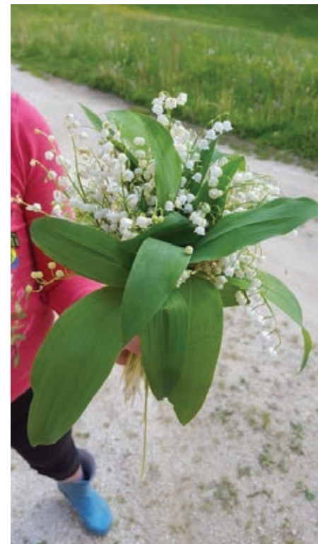
Slika 2: Šopek solzic iz Pekla