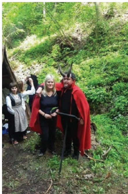
Slika 5: S predstave Pozdrav iz Pekla

na Strojni, posnetek režirane milenijske fotografije iz zraka in številni drugi, vključeni tudi vodeni ogledi jame Pekel. Prireditev Festival solzic, ki ima ime po solzicah, o katerih je pisal Prežihov Voranc, je poklon pisatelju, koroški dediščini, tradiciji, naravi in ljudem. Namenjena je druženju ob literaturi, glasbi, pesmi, folklori in kulinariki.