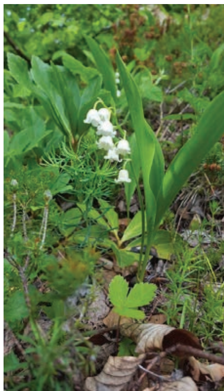
Slika 1: Šmarnica

Šmarnice cvetijo v mesecu maju, s tem je povezano tudi njihovo ime. Kot nam znanstve-