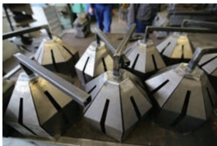
Slika 6: Zvonci solzice z nosilci

V nadaljevanju so izdelali še glavno nosilno cev in podstavek ter izvrtili odprtine za napeljevanje električnih kablov. Vse skupaj so s postopkom varjenja sestavili v celoto. Napeljali so še kabel za luči in priklopili na vir energije.