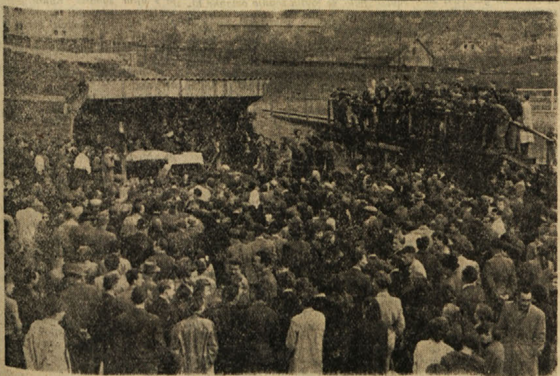
Nagravno žrebanje naročnikov "Zasavskega vestnika" 1. maja

ko pripominjajo še to, da se kletna in podstrešna stanovanja sploh ne štejejo za stanovanja in se zato tudi ne bodo vračunavala v število stanovanj. Jasno je torej, da je hiš zasebnih lastnikov, ki bodo prišle v stanovanjsko skupnost, pri nas prav malo, najmanj pa jih imajo tisti, ki že sedaj hite s predelovanjem in manjšanjem stanovanjskih prostorov. Prav tako je naše mnenje, da lastniki zasebnih hiš ne bodo plačevali od stanovanj in lastnih hiš prav nobene najemnine. Enako bi opozorili vse tiste, ki nameravajo graditi lastno hišo, da je še vedno v veljavi zakoniti predpis, da so take hiše za dvajset let oproščene vseh javnih dajatev in davčnin. Vsak razumen in trezen človek lahko iz prednjega razbere, da so vse navedene govornice v zvezi z stanovanjsko skupnostjo iz trte izvite in neutemeljene. Zato bo SZDL po naših tereh vse pojavljajoče se napačne razlage v zvezi z vprašanjem stanovanjske skupnosti pravilno tolmačila in zavzela tudi v tem pogledu stališče, kakršno narekujejo sodobni čas in socialistična skupnost. Iz Tajništva LOMO Trbovlje