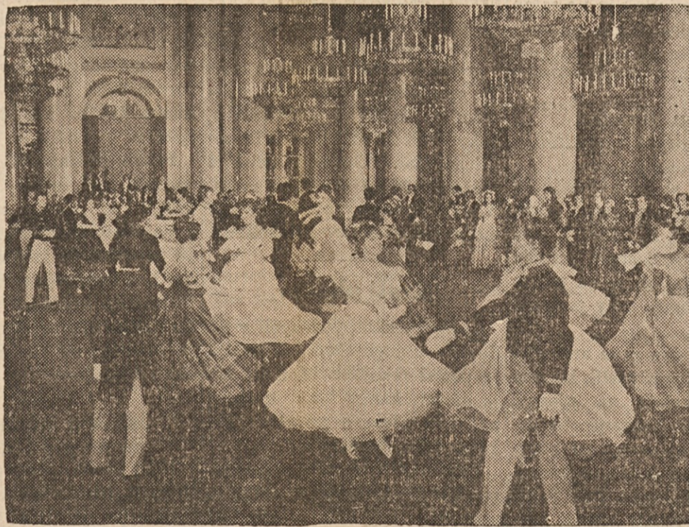
"VELIKI VALČEK" — To je naslov novega filma o življenju Johanna Straussa Jr. Na sliki vidimo ples valčka v dvorani nekdanjega cesarskega dvora na Dunaju iz tega filma.