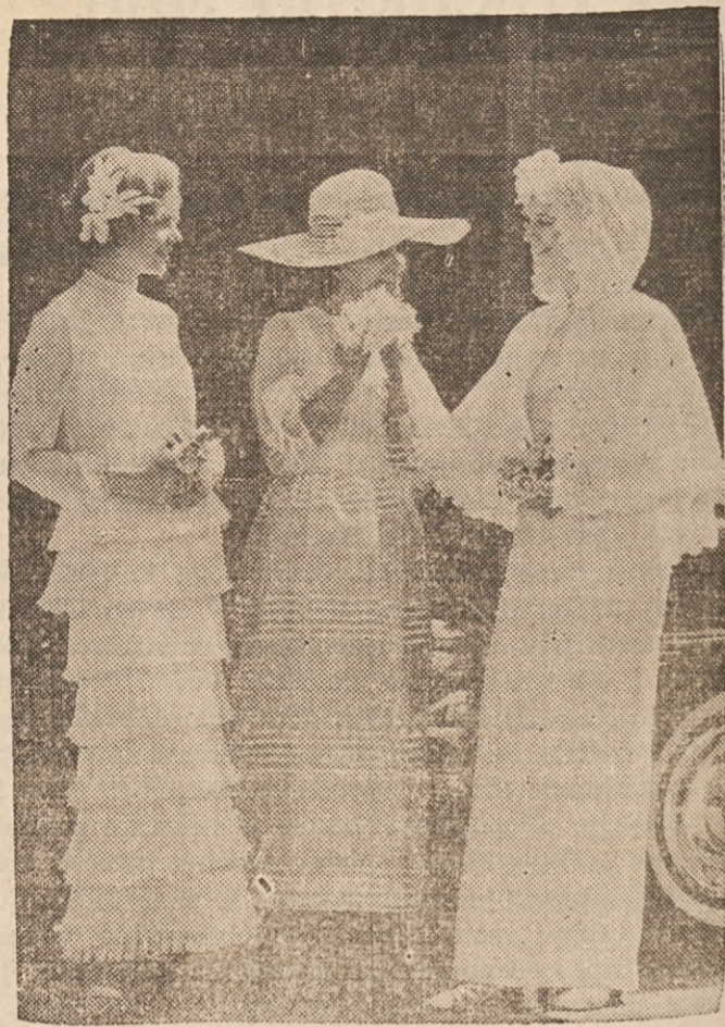
ESTONSKE NEVESTE — V Talinu v Estoniji, baltski državi, ki so jo Rusi v času druge svetovne vojne vključili v Sovjetsko zvezo, so razkazovali nedavno poročne obleke, ki jih vidite na gornji sliki.

20. — Pristavska noč v Slovenskem narodnem domu na St. Clair Avenue.