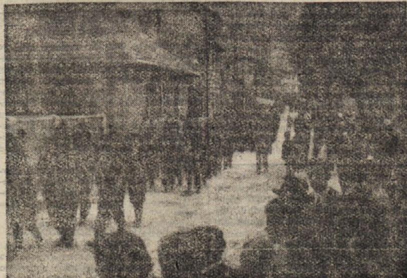
Skupina rudarjev mladincev v svečani povorki

Po nepopolnih podatkih petega dneva: NAD 3 MILIJARDE 672 MILIJONOV