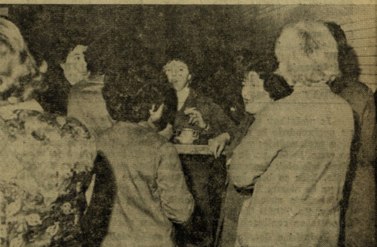
Smotrno izkoriščanje delovnega časa v jedilnici dne 5. maja 1979 ob 9.20