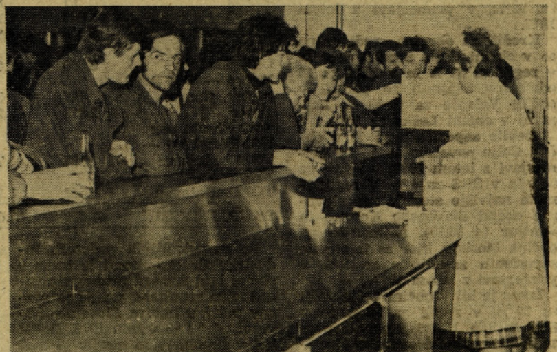
V jedilnici dne 5. maja 1979 ob 9.20

Vsa gornja vprašanja so vprašanja, glede katerih se odloča na referendumu, pa so iz tega razloga zbrana skupaj, da bi se o njih odločalo na enem referendumu. Sem sodijo še vprašanja s področja izpopolnitve splošnih aktov o nagrajevanju, ki jih podaja organizacijska služba. Predvideva se, da bi bil postopek glede gornjih vprašanj izpeljan v mesecu maju in juniju, tako da bi se referendum razpisal za drugo polovico meseca junija.