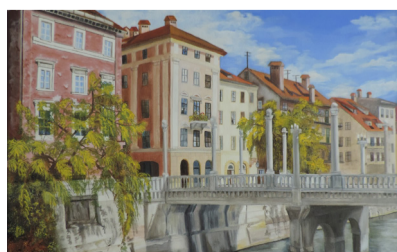
KAROLINA KENDA , 1. NAGRADA | likovna mladina