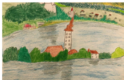
PETER KOCMUR , 1. NAGRADA | likovna otroci 6 do 9 let