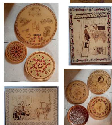
BIBIANA BAJDA , 2. NAGRADA | likovna odrasli

Pirografija in barvanje lesenih krožnikov. Slovenki pirhi.