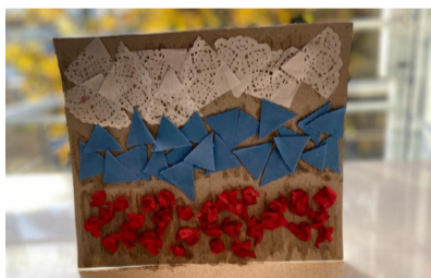
AGUSTINA VOLPEDO , 2. NAGRADA | likovna otroci 2 do 5 let