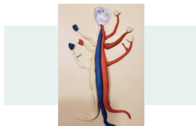
LAURA MODIC , 2. NAGRADA | likovna otroci 6 do 9 let