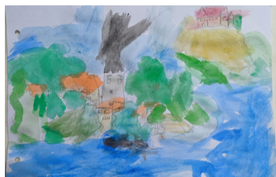
LJUBI MILENA SKALE , 2. NAGRADA | likovna otroci 2 do 5 let