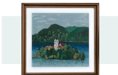
VERA RUPAR , 1. NAGRADA | likovna odrasli

Pirografija in barvanje lesenih krožnikov. Slovenki pirhi.