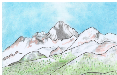
MARJANCA LUCIJA ČOP , 2. NAGRADA | likovna otroci 10 do 12 let