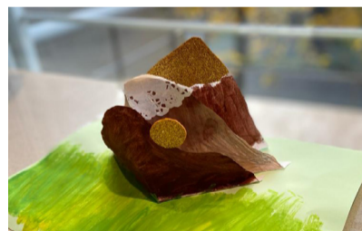
EMILIA VOLPEDO , 1. NAGRADA | likovna otroci 2 do 5 let