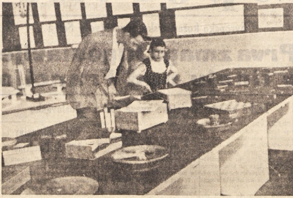
Industrijska strokovna šola v Rojani