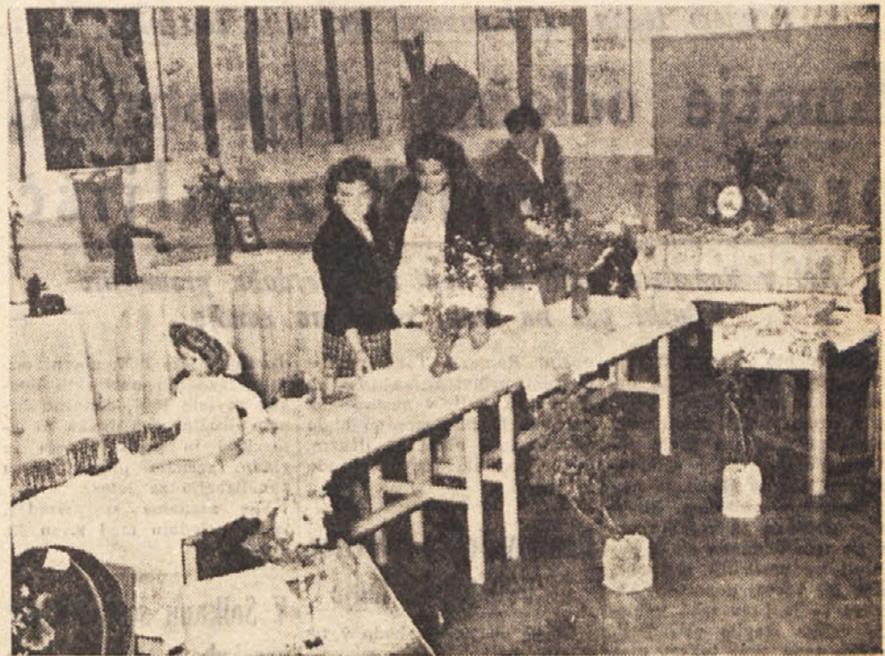
Osnovna šola v Zgoniku