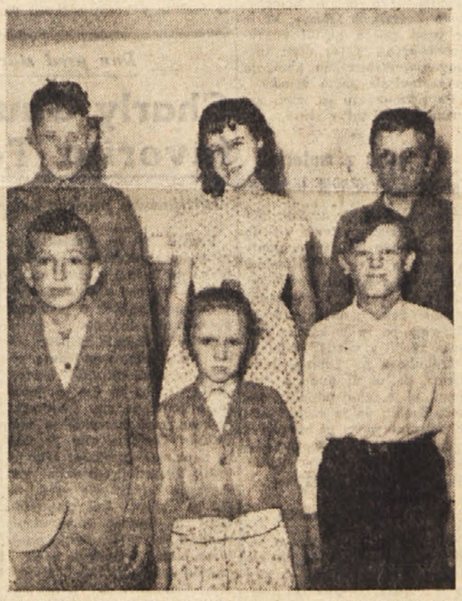
Otroci iz osnovne šole v Silvem, ki so sodelovali pri razstavljanju šolskih prireditev