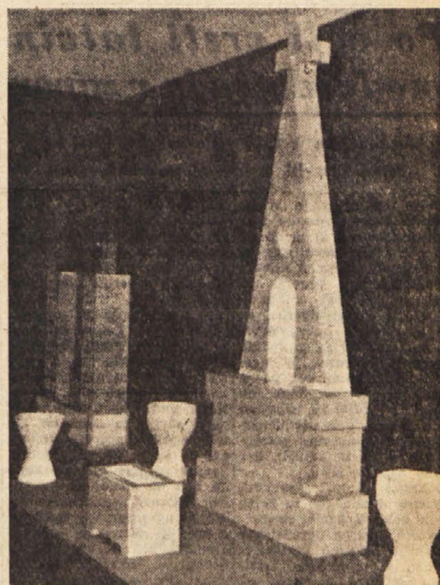
Industrijska strokovna šola v Nabrežini