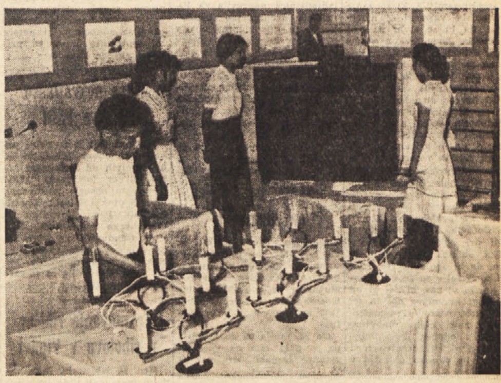
Industrijska strokovna šola v Sv. Križu