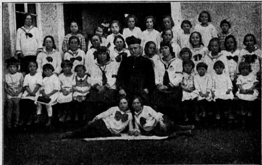
Mladenke in Gojenke orliškega krožka v Trzišču (Dol.).

Jaz sem več kakor deset let stara. Mračno se še spominjam, kako me je včasih zeblo pred cerkvijo svetega Jožefa, in me ni imela mama v kaj ogrniti, se še spominjam, da je bila črna, grenka moka naložena tam, kjer so dandanes oltarji, na katerih molimo, v beli hostiji, Kristusa, Kralja miru, se še spominjam, kako sem bila včasih lačna.