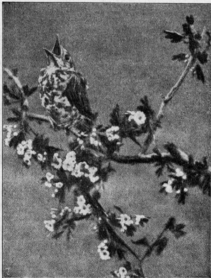
»Lačen, lačen!« kliče mladi drozg mamico.

Različki igre: 1. Namesto, da bi dal en sam udarec onemu, ki ga zajame, lahko da dva ali tri. 2. Črni mož in njegovi pomočniki si dajo roke in tvorijo verigo.