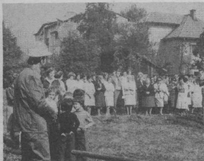
Navzoči so prisluhnili govornikom in obkrožili prostor, kjer bo stal prizidek ZD za otroški dispanzer.