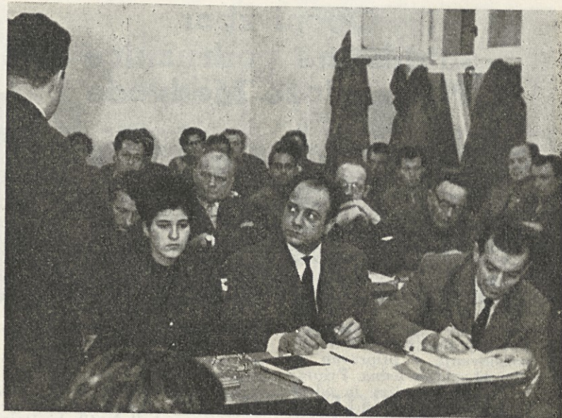
Med konferenco v Vevčah

Glede na to bo TD Radomlje tudi v mesecu marcu organiziralo nekaj podobnih predavanj, od katerih bodo nekatera obravnavala našo ožjo domovino Slovenijo, njene lepote in naša prizadevanja, da se pri naših sosedih in tudi drugod čimprej afirmiramo kot turistično dobro organizirana dežela.