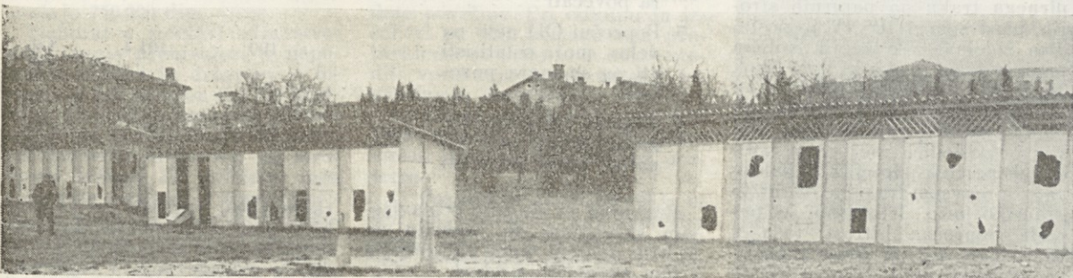
Količevci dobro poznajo te kabine. Posnetek je iz Izole, kjer ima naša počitniška skupnost naselje weekend hišic. Poglejte, kako so neznanzi zlikovci »zdelali« kabine

Kje je montirana ta lestev in čemu služi? Odgovor pošljite sekretariatu podjetja. En pravičen odgovor bo izžreban in nagrajen s 1.500 din