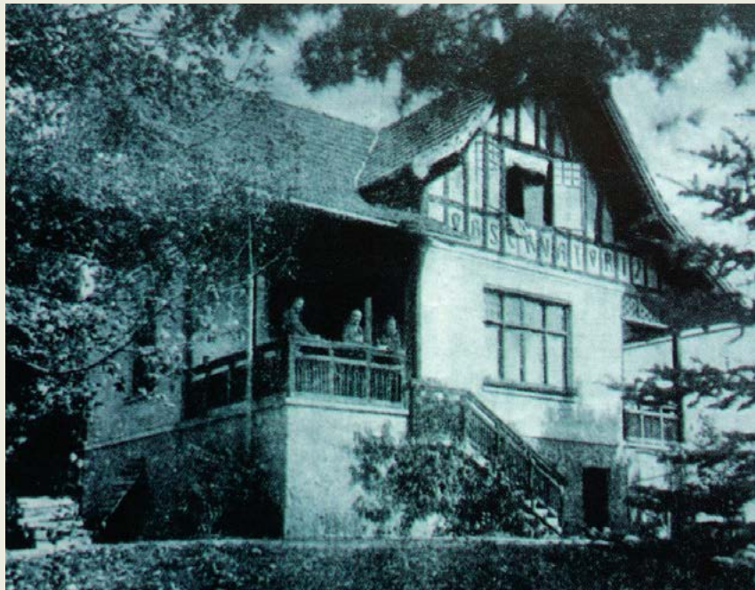
Belarjeva vila v Podhomu nekoč, delo arhitekta Maksa Fabianija. Veljala je za najlepšo vilo na Kranjskem.

"Kot vsaka gorska dežela je tudi Kranjska bogata z