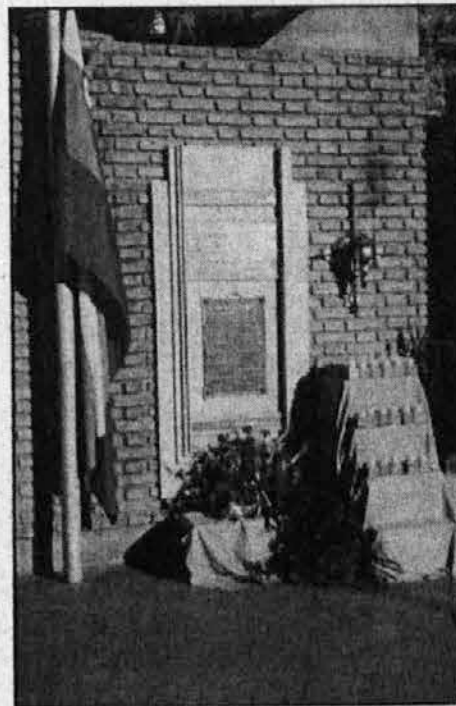
Spominska plošča s plamenico.