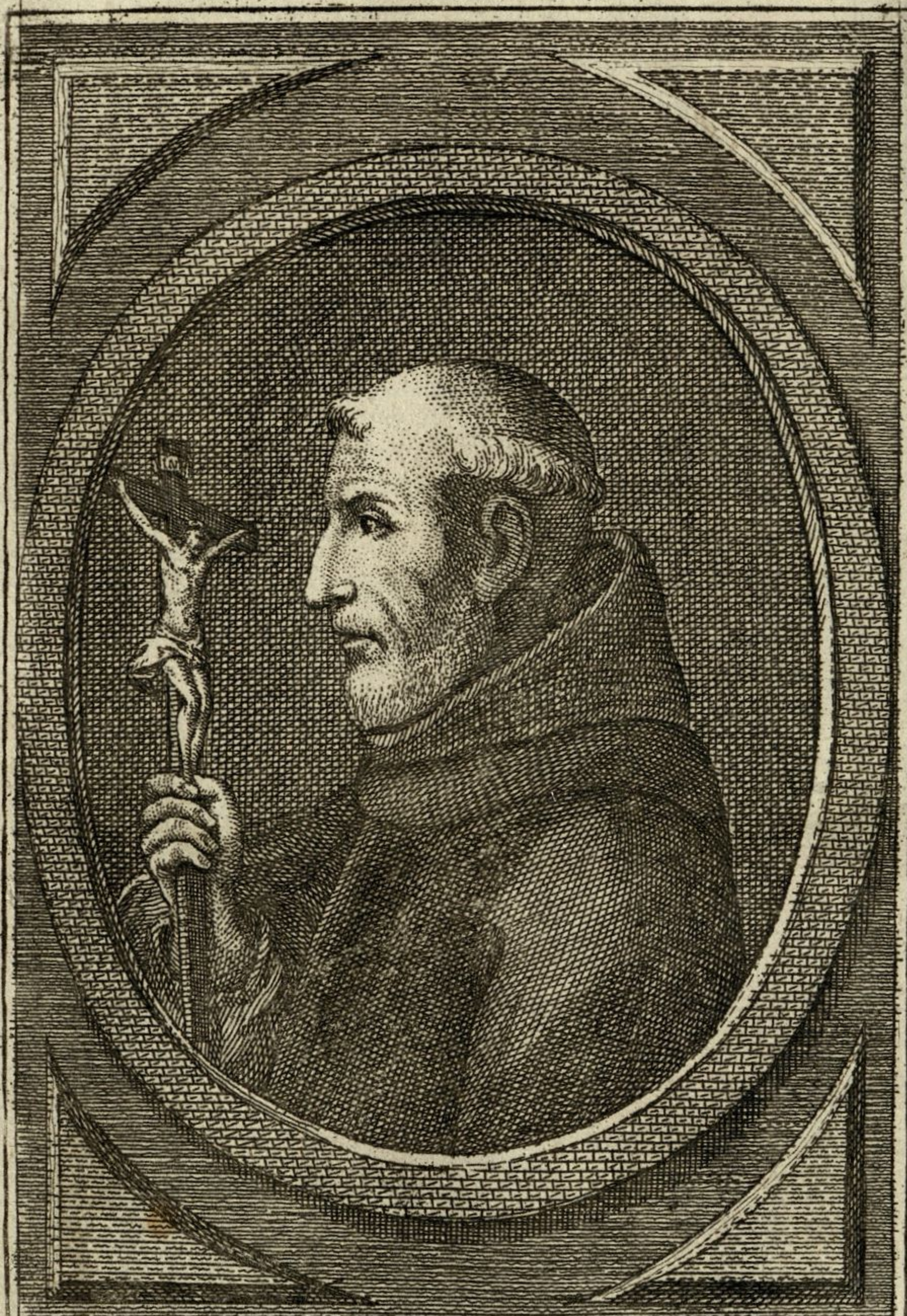
Abbildung des seligen Leonard von Porto Maurizio Apostolischen Missionär, Fran- ziscaner Reformirten Ordens