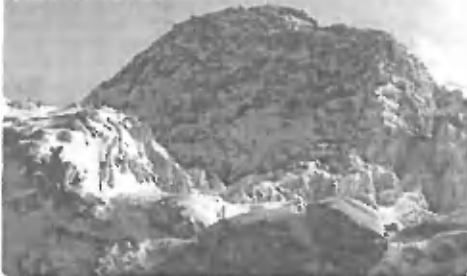
Vhod v jamo Češn 2 je na višini 20 metrov pod vrhom Bandere

Še več fotografij si lahko ogledate na domači strani odprave "Potovanje v središče zemlje" http://www.aol.net/cehn2/