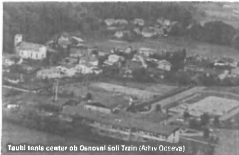
Taubi teniški center ob Osnovni šoli Trzin

Torej to pomeni, da bi moral najemjemalca le plačevati najemnino, ne bi pa imel več obveznosti zagotavljati brezplačnega pouka tenisa? Ne, plačevati bi moral najemnino in amortizacijo. V novi pogodbi je opredeljeno, da če pride do izvajanja pouka in izra-