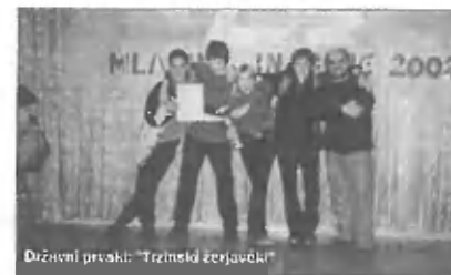
Državni prvaki: Trzinski žerjavčki

Tekmovalci so najprej pisali teste, v katerih so bile zastopane teme planinske šole in tudi tema tekmovanja Ljubljanska mladinska pot.