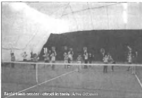
Tajnik-tenis center - otroci in tenisi