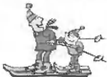
Smučarsko društvo Trzin

Prijave s plačilom tečaja bomo sprejemali v petek, 15.02.2002, od 18.00 do 19.30 v društvenih prostorih Občine Trzin (stara osnovna šola, Mengeška cesta 22) in na smučišču Dolga dolina vsako soboto in nedeljo od 10h do 16h.