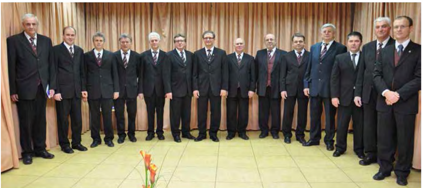
Lipovski moški pevski zbor je zapel tudi zlatomašniku