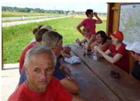
Po pohodu smo se osvežili in družili v prijetnem hladu

Kulturno-turistično društvo Dokležovje je v nedeljo, 16. junija 2013, za vse ljubitelje narave in rekreacije željne posameznike organiziralo pohod. Udeleženci so se na okrog devet kilometrov dolgo pot podali izpred vaško-gasilskega doma Dokležovje, nato pa nadaljevali po poljskih poteh proti Bratoncem, kjer so imeli tudi krajši postanek za osvežitev in okrepčilo. Pohoda se je udeležilo okoli dvajset krajanov in