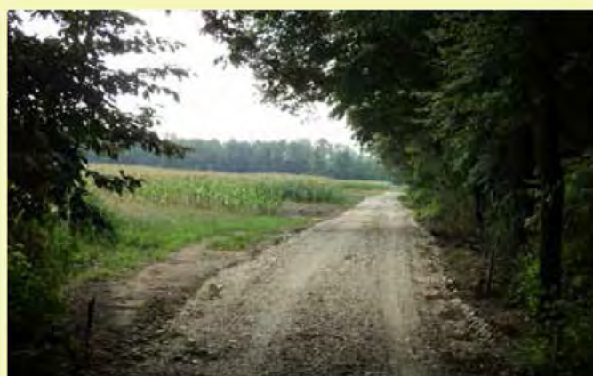
...in novo stanje kolovoza ob Sloparci