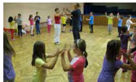
Pripravili smo tudi splet Šmentana muha

Ob zaključku leta smo nastopili tudi v OŠ Bakovcih na Festivalu znanja in spretnosti s pletom Šmentana muha.