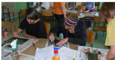
Na taburu je bilo zelo ustvarjalno

Na OŠ Bakovci je od 26. do 28. junija potekal jubilejni 20. tabor Žabec. Udeležili so se ga učenci iz Tišine, Bakovcev in Murske Sobote. Za udeležence tabora je