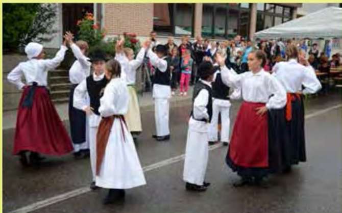
Na prireditvi "Varno od šanka do šanka" so zaplesali tudi osnovnošolski folklorniki