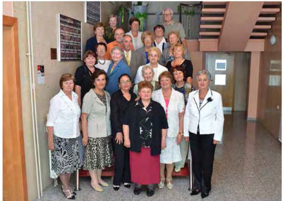
Skupinska fotografija učiteljiščnikov v hotelu Diana

V veselem vzdušju smo obujali spomine na naše srednješolsko obdobje in izbrskali marsikatero zanimivost. Vsa leta smo bili prijetna družčina