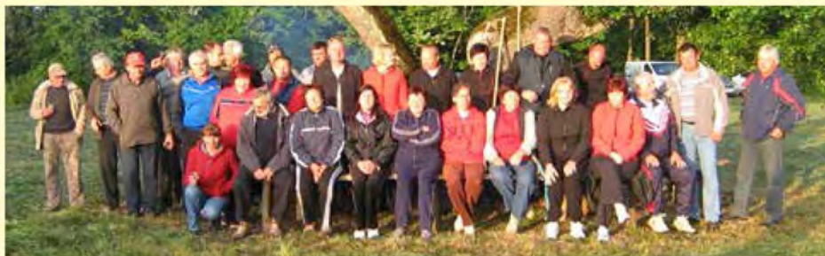
Zbrana družba pri poslušanju jutranjega ptičjega petja

Ko se odpravimo na sprehod v naravo, nas skoraj vedno razveselijo ptički s svojim petjem.