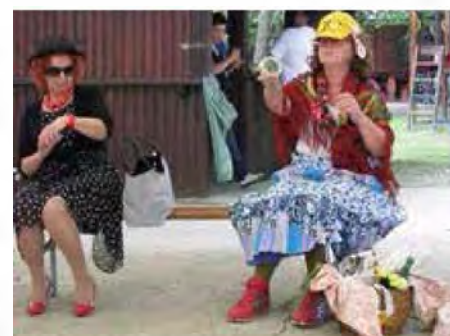
Upokojenki sta nas v priložnostnem skeču "Na avtobusni postaji" do solz nasmejali