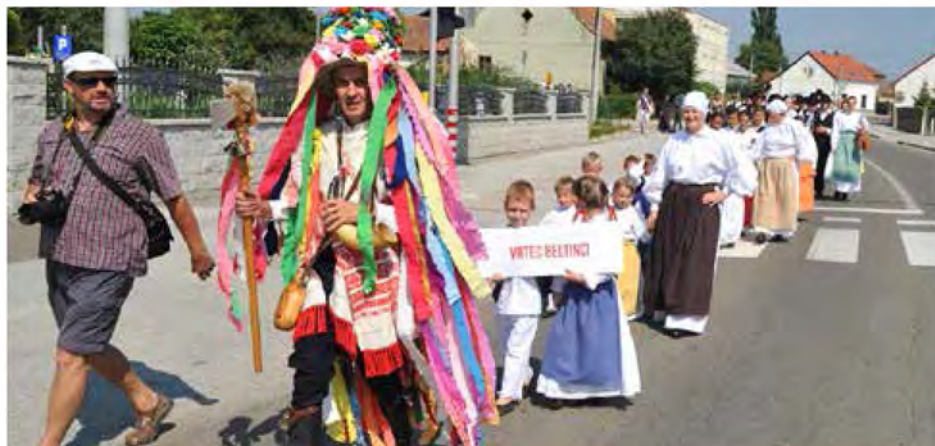
S povorko skozi središče Beltincev želi KUD Beltinci spodbuditi obiskovalce k ogledu pestre oblačilne dediščine na Slovenskem

Folkorni navdušenci in tisti, ki stajim ljudsko in domače blizu, so imeli kaj videti, slišati in končno okusiti tudi na letošnjem že 43. mednarodnem folklornem festivalu.