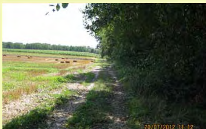
Staro stanje kolovoza ob Sloparci...