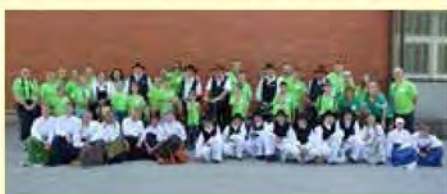
Folklorniki OŠ Beltinci s prijatelji iz Hamiltona

»Vsi mi pravijo, ka je bilou v Prekmurju najlepše, kak smo dobro jeli, pa se družili z domačimi lidmij, pa si gučali po domače.... pa vsi ste se tak trudili.«