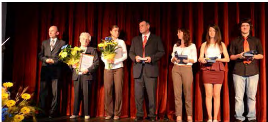
Nagrajenci Občine Beltinci in zlati maturanti v letu 2013

Tako so se začela mednarodna srečanja folklornih skupin že leta 1971 pod geslom »Pesem in ples družita narode«, ki se je ohranilo vse do danes. Festivali so postali tradicionalni. Iz leta v leto so se bogatili še z drugimi dejavnostmi in spremljevalnimi programi, saj folklor ni le ples in petje – so ljudski običaji, ljudska opravila, ustvarjalnost, druženje, sodelovanje, povezovanje in nenazadnje zadovoljstvo vseh prisotnih. Vse to so uvrščali v programe, bogatili ljudsko kulturo, jo odkrivali in čuvali ter ohranjali za prihodnje rodove. To je kultura nekega naroda, ki jo je potrebno ceniti in spoštovati. Drugi namen festivalov pa je bil združevati narode med seboj. Posebna skrb je bila sodelovanje in medsebojno povezovanje naših manjšin in zdomcev z matičnim narodom. Folklorna skupina je na mednarodnem področju odpirala okno v svet našim rojakom v sosednji Madžarski, povezovala pa je tudi naše zamejske rojake v Avstriji in Italiji ter v sosednji Hrvaški.