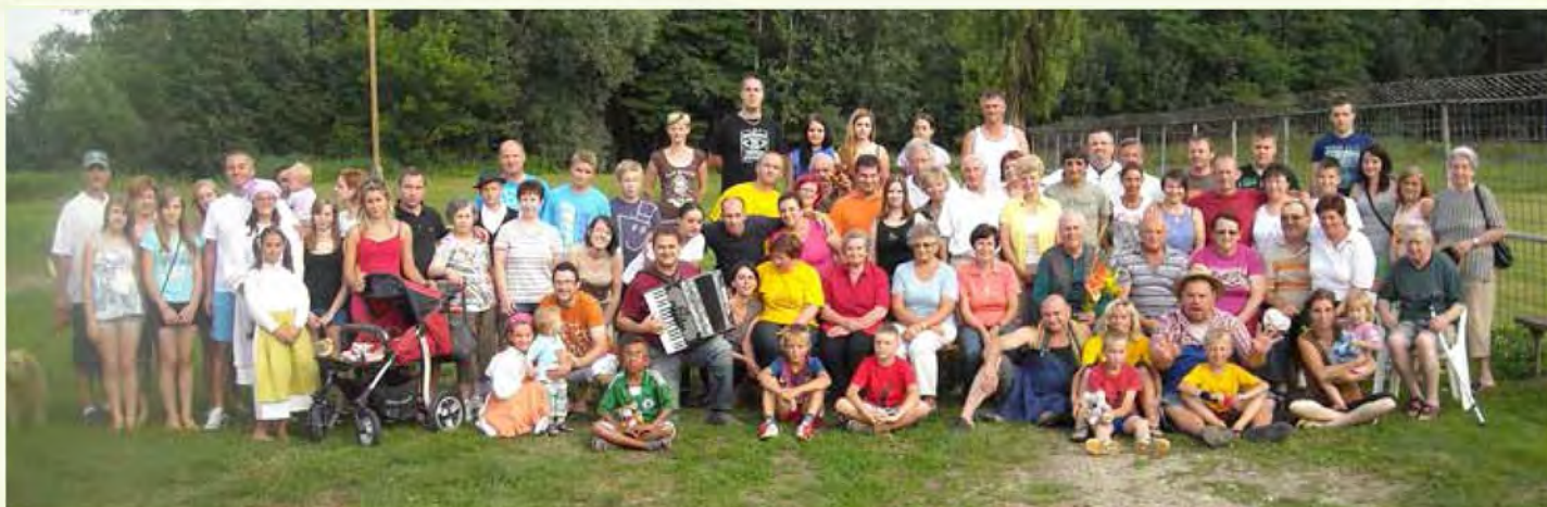
Krajani Severne ulice »na küpe«