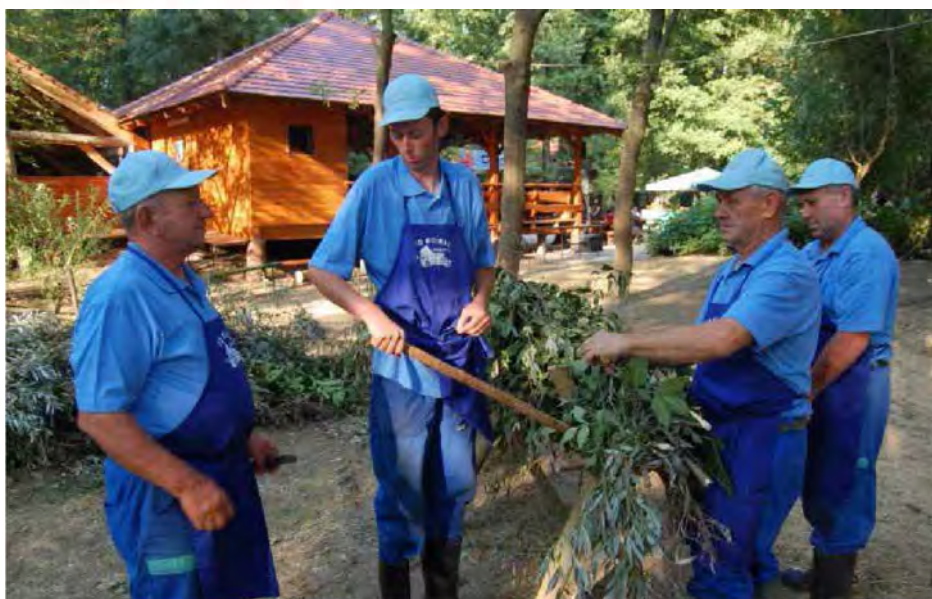
Prikaz izdelave fašine na Būjraških dnevih