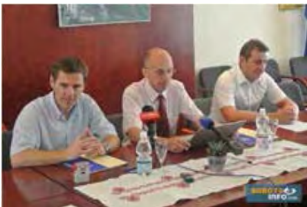
Svečani podpis pogodbe z izvajalcem del SGP Pomgrad d.d.

Občina Beltinci je v mesecu avgustu 2013 začela s prenovno dveh lokalnih cest, in sicer Beltinci - Melinci in ceste Ižakovci - Melinci - Gornja Bistrica in z izgradnjo hodnikov za pešce v naseljih Ižakovci in Melinci. Po izvedeni rekonstrukciji se bo na omenjenih odsekih cest bistveno povečala prometna varnost. Za oba projekta je bilo na javnem razpisu izbrano podjetje SGP Pomgrad d.d. Dela bodo zaključena predvidoma do oktobra 2013. Projekt delno financira Evropska unija iz Evropskega sklada za regionalni razvoj.