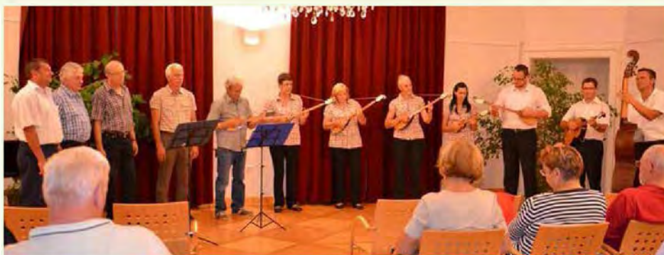
V grajski dvorani so tamburice zazvene v družbi čudovitih vokalov

V torek, 13. avgusta 2013, smo se zbrali v dvorani beltinskega gradu, kjer smo pozdravili vsem nam drage in ljube tamburaše TAMBURAŠKE SKUPINE KUD-a BELTINCI . Tamburice, pravimo jim tudi brač, so že nekoč davno bile tisti instrument, ki je iz svojih strun tenkočutno in nežno izvabljal najlepše melodije, pa naj so to ljudske pesmi, klasične in zabavne skladbe, pa tudi tiste čudovite dalmatinske viže. Vse oz. vsaka od njih se je dotaknila naših src in obudila spomine na nam drage trenutke in čase preteklih dni.