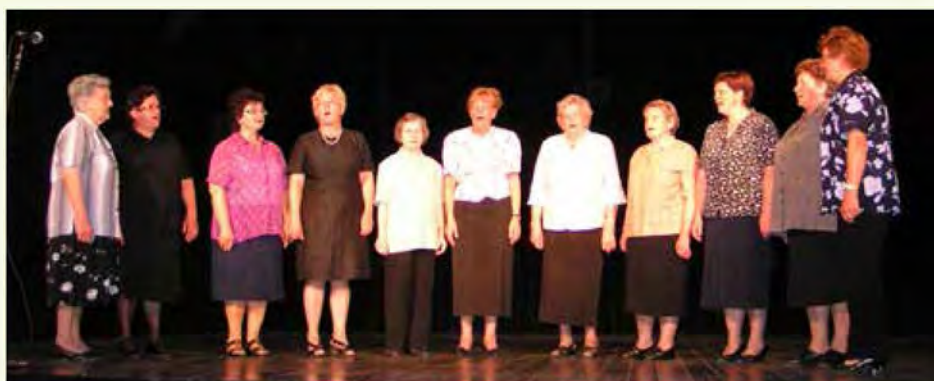
Nastopajoči so s svojim petjem in igranjem navdušili zbrano občinstvo