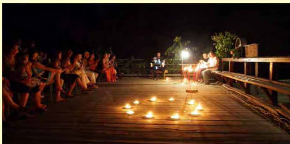
Mitološki večer z vilami, poezijo in glasbo je potekal v čudovitem ambientu ižakovskega broda