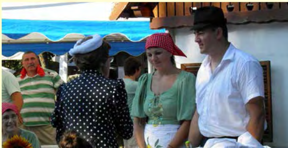
Botro so zmeraj lepo sprejeli

Člani TD in ljudske pevke iz Lipovcev smo na letošnjem folklornem festivalu v živo prikazali obisk botre pri družini novorojenega sinka, ki je bil že deveti otrok v družini. Vam in nam smo želeli priklicati v spomin stari običaj, ki je bil živ pred približno šestdesetimi leti.