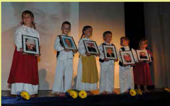
Vrteški otroci s fotografijami dosedanjih častnih občanov