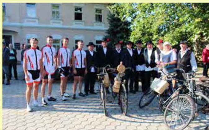
Štirje kolesarski mušketirji v družbi Dimekov pred štartom...