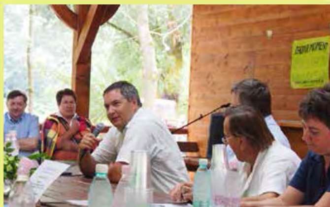
Na tradicionalni ekološko obarvani okrogli mizi je aktivno sodeloval tudi minister za kmetijstvo in okolje Dejan Židan