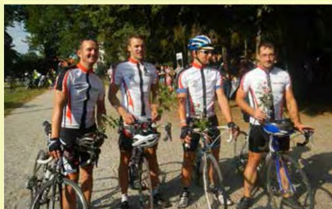
... in na sprejemu ob srečnem povratku