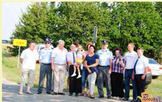
Člani Sveta za preventivo in vzgojo v cestnem prometu s predstavniki Občine, KS Lipa in Policije ob predaji namenu novega merilca hitrosti v Lipi