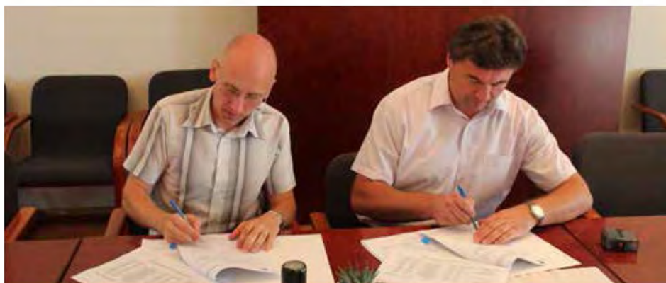
Svečani podpis koncesijske pogodbe

Na podlagi izvedenega javnega razpisa, je občina Beltinci izbrala izvajalca za redno vzdrževanje lokalnih cest v občini Beltinci, za obdobje treh let. Kot najugodnejša izmed prispelih ponudb je bila ponudba Cestnega podjetja Murska Sobota d.d., s katerim je bila podpisala tudi koncesijska pogodba, v skladu s katero