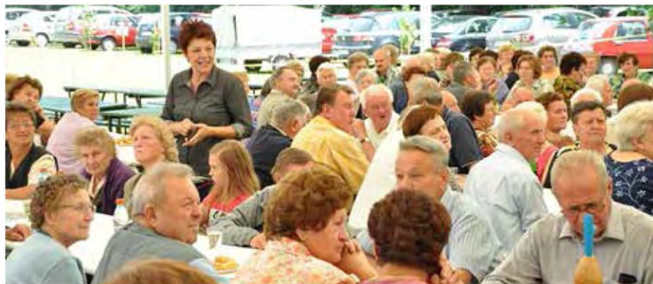
Združeni upokojenci občine Beltinci na Poletnem srečanju na Melincih

JAVNI RAZPIS ZA SOFINANCIRANJE PROGRAMOV IN PROJEKTOV DRUGIH DRUŠTEV Občine Beltinci v letu 2013.