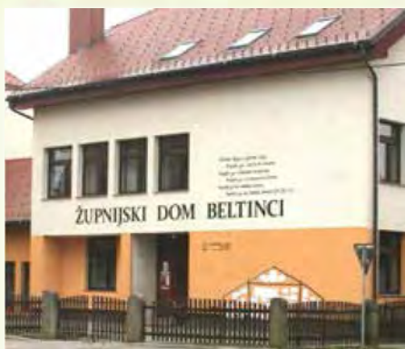
Sedež Glasbene šole

Zgodovina Glasbene šole Beltinci je stara več kot pet let. Po pripovedovanjih nekaterih kulturnih delavcev se je začelo že mnogo prej, saj so se posvetili Osnovne šole Beltinci v nove prostore že porajale ideje o glasbeni šoli v beltinskem gradu. Navsezadnje je tukaj glasbena tradicija že dolgo časa zelo močna. Poleg folklorne tradicije in tamburašev so bili v Beltincih tudi zelo dobri pevski zbori in kar nekaj dobrih godcev. Močan pečat na področju glasbenega izobraževanja so prispevali