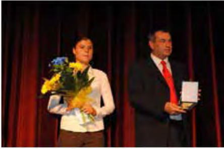
Prejemnik plakete občine Beltinci - ŽNK Teleing Pomurje Beltinci