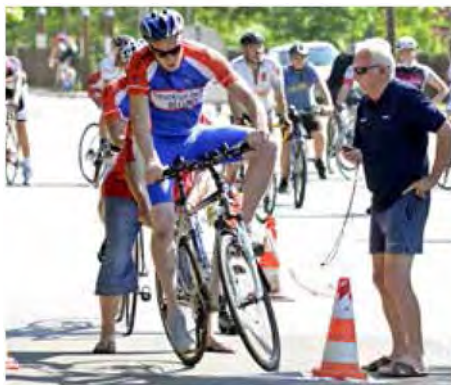
Atraktiven štart tekmovalca na Beltinskem kronometru

Kolesarski klub KK Tim Mlin Beltinci je v soboto, 22. junija 2013, uspešno izpeljal tradicionalni Beltinski kronometer. Od leta 2005, ko so člani kluba organizirali prvega, je bil ta že deveti po vrsti. V lepem in sončnem vremenu se je na 10,8 kilometrov dolgo progo Beltinci-Gornja Bistrica-Beltinci podalo 33 rekreativnih kolesarjev, ki so tekmovali v petih kategorijah - cestna kolesa, trekking in gorska kolesa, ženske, mladina