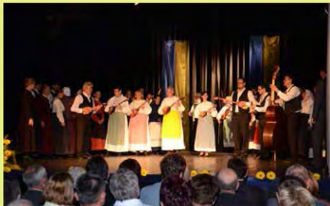
Na osrednji svečanosti ob občinskem in državnem prazniku so združili moči članice in člani KUD Beltinci in KD Marko