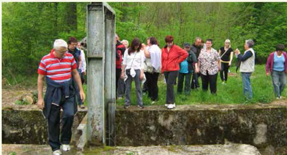
Pohod mimo starih zapornic na Ledavi

Člani našega društva že vrsto let organiziramo pohod v naravo. Letos smo se odločili, da ga izvedemo nekoliko drugače kot v prejšnjih letih, zato smo si izbrali tudi drugačno pot.