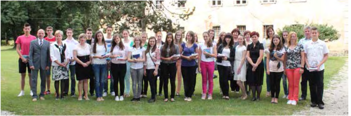
Odličnjaki in predstavniki šol na slovesnem sprejemu pri županu