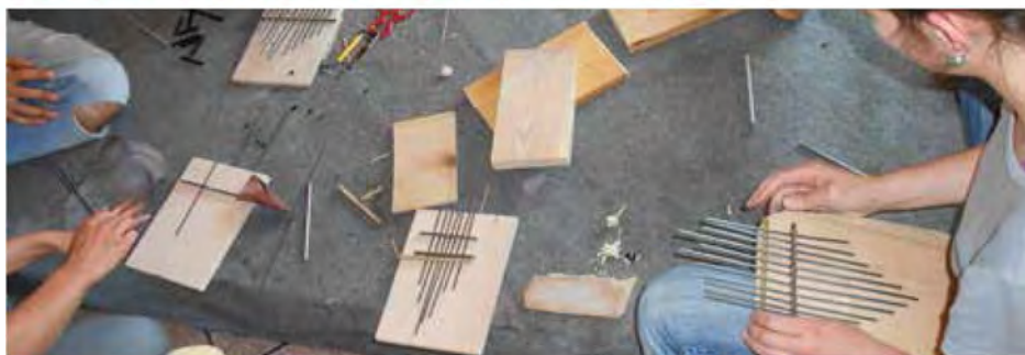
V sklopu Majanja smo izdelovali tudi glasbene instrumente - na sliki je predstavljena izdelava kalimb

Prevroči dnevi aktivistov Društva iniciative mladih nikakor niso uspavali oz. demoralizirali, saj smo naše aktivnosti uspešno izvajali tudi v času nehvaležne poletne mrtve klubske sezone, ko je večina potencialnih obiskovalcev kajpak na dopustih, oziroma na večjih glasbenih festivalih doma in v tujini, ki potekajo na prostem.