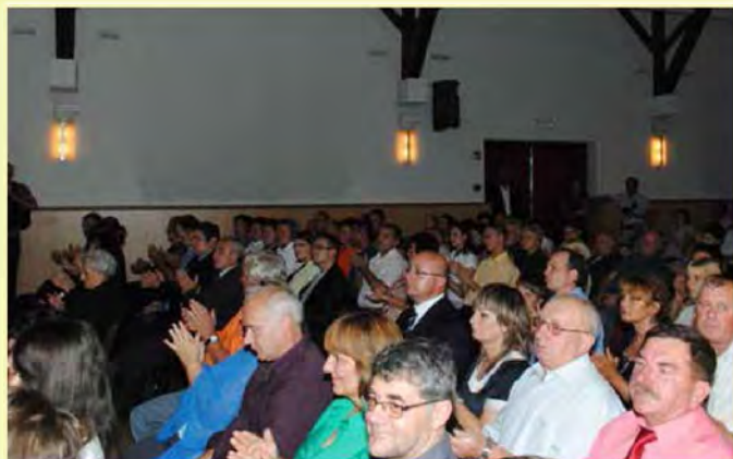
Utrinki z petkovega večera - predstavniki Poljske v tretji vrsti