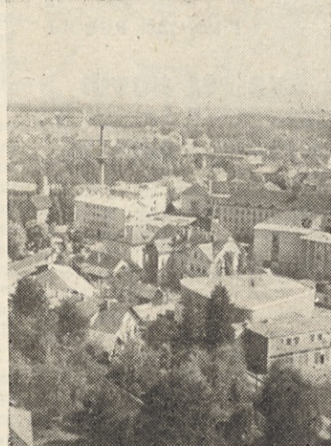
▲ Takle je pogled na naš obrat v mestu z novega nebotičnika