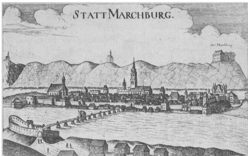
Slika 1: Maribor proti koncu 17. stoletja (G. M. Vischer, Topographia Ducatus Stiriae , 1681)