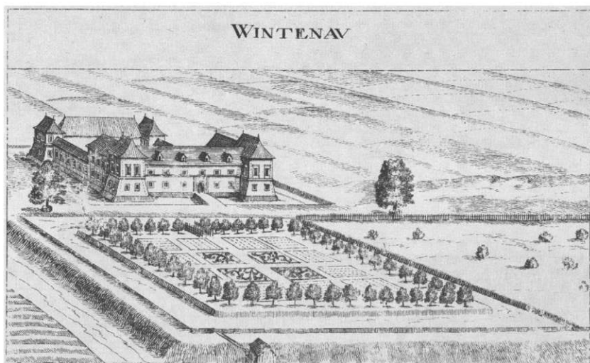
Slika 2: Dvorec Betnava proti koncu 17. stoletja (G. M. Vischer, Topographia Ducatus Stiriae, 1681)

Pokopališče je bilo zgrajeno v letih 1588-1589 in je merilo okrog 813 m 2 . Molilnica oziroma avditorij je bila postavljena leto zatem in je vseh deset let obstoja ostala lesena. Evangeličanska bogoslužja na Dravskem polju so dotlej potekala na dvorcih Betnava in Ravno polje ter na gradu Vurberk. Poskusi, da bi jih za celoten okraj organizirali na gradovih Gornji Maribor, Slivnica in Rače ali v dvorcu Ravno polje, so propadli. Na svojo hišo na Betnavi je moral do leta 1589 počakati tudi predikant Lierzer. Dotlej je vsaj leto dni živel v bližini Viltuša, v