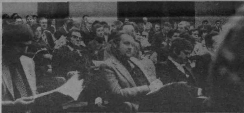
S srečanja organizatorjev obveščanja v združenem delu.