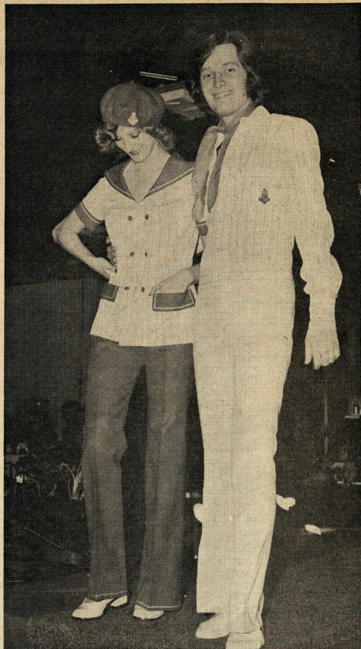
Mornarski stil je bil bogato zastopan na naši komercialni modni reviji in tudi toplo sprejet.

Artikel Blue-Jeans je naš novi izdelek iz 50 % diolena in 50 % bombaža. Ta artikel je bil deležen visokega priznanja na letošnjem sejmu mode; dobil je kipec »Ljubljanski zmaj«. Na sliki sta dva športna modela iz tega artikla.