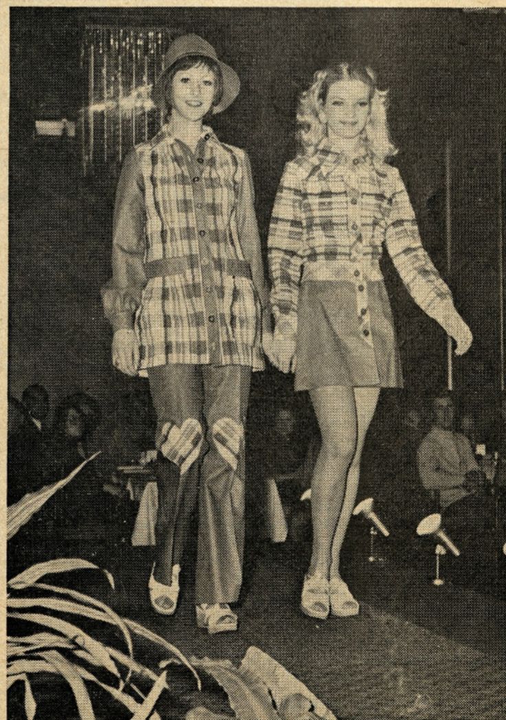
Pestrotkani seercucher je moderen in zelo primeren za izdelavo modelov za najstnice. Tu sta dva modela iz te skupine, prikazane na reviji.