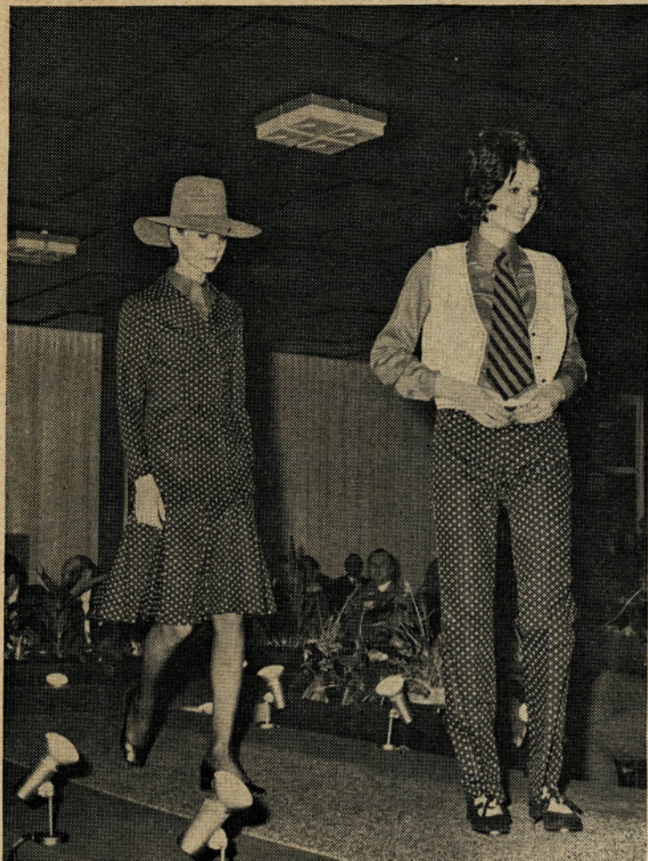
Iz naše redne proizvodnje je artikel Beatrix. To je strukturna bombažna tkanina, potiskana z modnim pikčastim desnom, primerna za mladostne in resne modele.