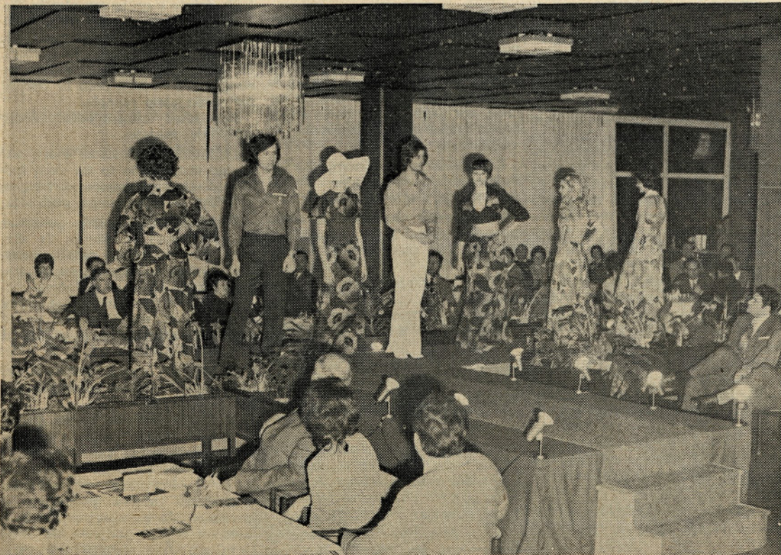
Defile modelov iz komercialne modne revije v GOLF hotelu na Bledu. Več o tem preberite na 5. strani.