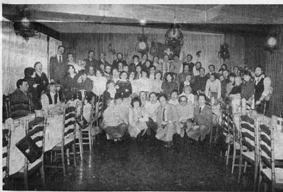
Skupinski posnetek ob koncu srečanja skavtov in skavtinj v Dolini