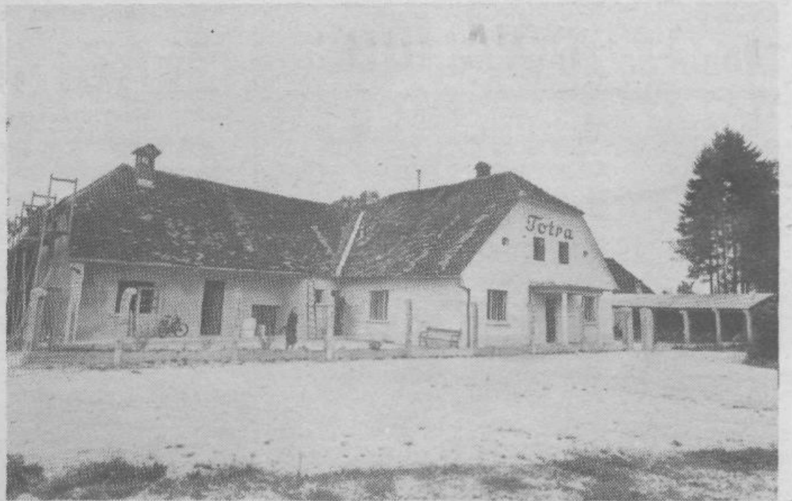
Tole je upravna zgradba Totre iz leta 1957 (proizvodnja vezalk še vedno poteka v dokaj težavnih in neustreznih delovnih pogojih)

TOVARNA POZEMENTERIJE IN PREDELAVE PLASTIČNIH MAS TOTRA POD LEČO