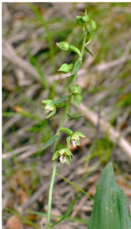
Slika 3: Pontska močvirnica ( Epipactis pontica ) nad dolino Trente, ob cesti na Vršič.

Figure 2: Epipactis pontica , above Zagrad in Čičarija (Relevé 1 in Table 1).