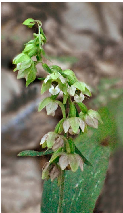
Slika 2: Pontska močvirnica ( Epipactis pontica ), Čičarija, nad Zagradom (popis 1 v preglednici 1).

Figure 2: Epipactis pontica , above Zagrad in Čičarija (Relevé 1 in Table 1).