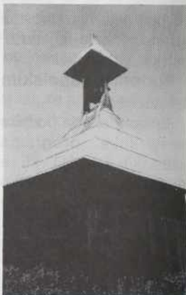
... v našo krajino se nikak ne šika svetli plej.

če bi je stoj raztrauso. V tau ves človek gdakoli pride, tu je furt mir. Tu estja večkrat čuje človek ftiče popejvati, kak autona trzariti.