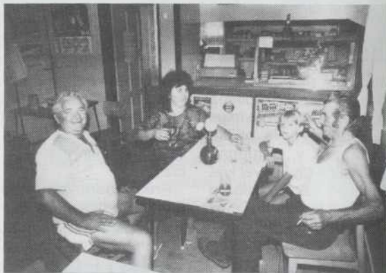
V vesi edno mesto dje, gde se listvo leko sreča ... Tau je krčma.

je najstarejša zidina zvonik. Leta 1823 so ga redli. Te je štja s slamo bijo pokrit. Gda je slama na nikuj prišla, so ga pokrili s prčnjami. Ne vejn, ka koma prišlo na pamat, dapa zdaj je s plejom pokrit. Tak mislim, ka v našo krajino se nikak ne šika svetli plej. Zvojn tauga je zato ves dojn lejpa. Tak so se rami zidali po brgaj, kak