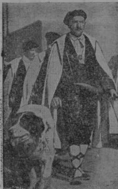
Na svetovno razstavo v Pariz prihajajo iz raznih francoskih pokrajin Francozi v starih narodnih nošah.

Ožarjen vstaja ob dvajsetletnici smrti pred našimi očmi duhovni lik velikega dr. Kreka. Živi Krek ni maral slavo- in hvalospevov, tudi mrtvemu nočemo zažigati kadila. Nagib, ki nam je merodajen za proslavo njegovega spomina, je naš nesmrtni voditelj škof Slomšek v »Drobtinicah« leta 1862 (v letu svoje smrti, tri leta pred Krekovim rojstvom) tako opredelil: »Hvaliti svoje rajne dobrotnike, povzdigovati njihova lepa dela in znamenite zasluge nam je ravno toliko dolžnost, kakor posnemati njihove slavne zglede. Kdor ne časti svojih slavnih prednikov, ne zasluži biti njih vrli naslednik.« Krek je velik dobrotnik slovenskega naroda, za