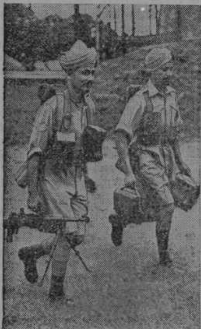
Najmodernejšo strojnico je dobila Indijska vojska, kateri poveljuje Anglija. Na sliki vidimo Indijsko vojska z novim orožjem.