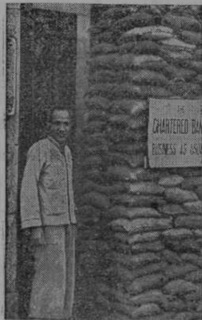
Za s peskom napolnjenimi vrečami poslujejo v Sangaju radi krogel banke.

katerega je storil nebroj prelepih del ter si pridobil premnogo znamenitih zaslug. Zato nas obvezuje dolžnost hvaležnosti, da proslavljamo njegov spomin. V tem spominu je tudi vključena pobuda k posnemanju njegovih slavnih zgledov. Krekove ideje so še vedno žive. Naj bi tudi bile zmeraj životvorne med našim ljudstvom, zlasti med slovensko mladino!