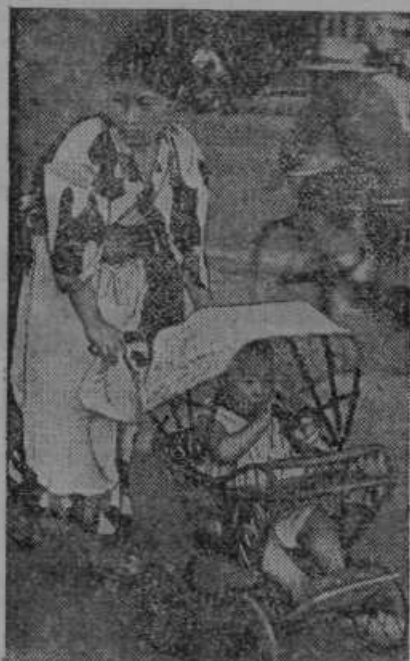
Po kitajskih mestih so ženske in otroci v neprestani smrtni nevarnosti radi bomb iz japonskih letal. V japonski prestolici v Tokio matere mirno vozijo vozičke s svojimi otroci.