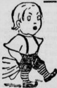
Din poštne prosto.

vskovrstnega sukna in hlačevine za moške obleke A. & E. SKABERNE — Ljubljana, Mestni trg 10.