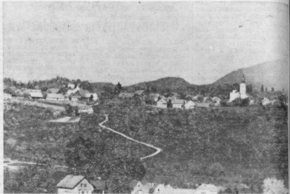
PONIKVA v občini Sentjur je kraj, kjer bodo občani šentjurske komune letos slavili svoj občinski praznik 18. avgusta. Ze dalj časa je v Sentjurju navada, da vsakoletni občinski praznik slavijo v drugem kraju. V Ponikvi se ljudje že sedaj pripravljajo na ta veliki dogodek.