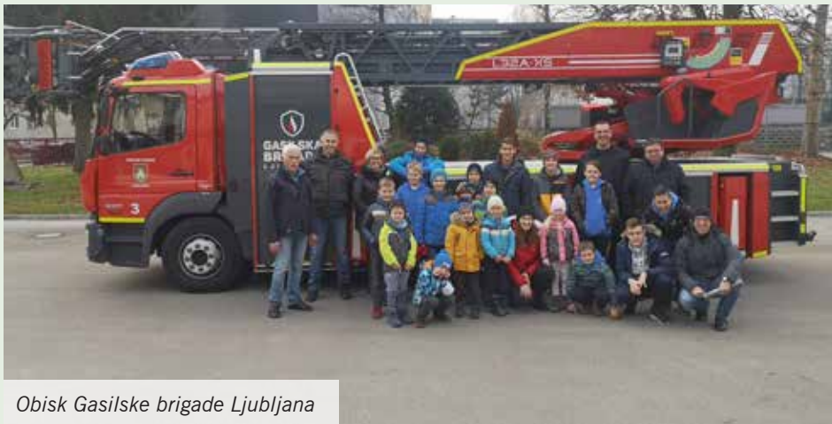
Obisk Gasilske brigade Ljubljana

V začetku meseca se je skupina mladih gasilcev pod vodstvom mentorjev zbrala v gasil-