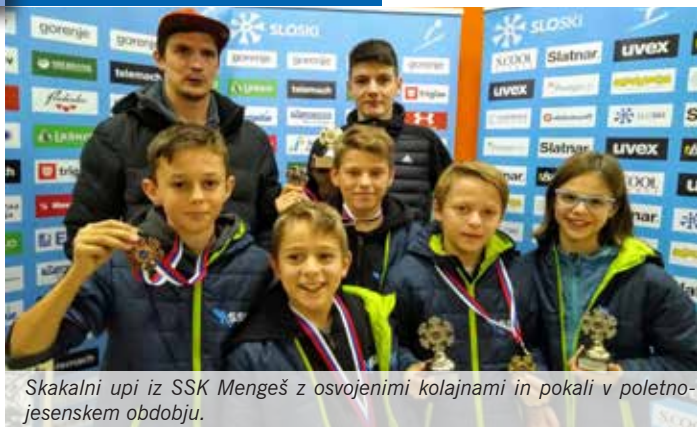
Skakalni upi iz SSK Mengeš z osvojenimi kolajnami in pokali v poletno-jesenskem obdobju.