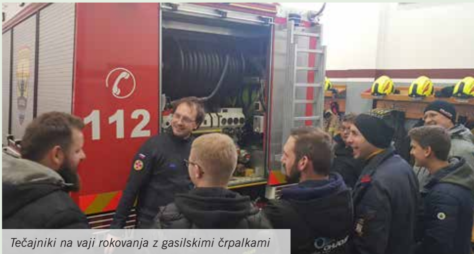
Tečajniki na vaji rokovanja z gasilskimi črpalkami