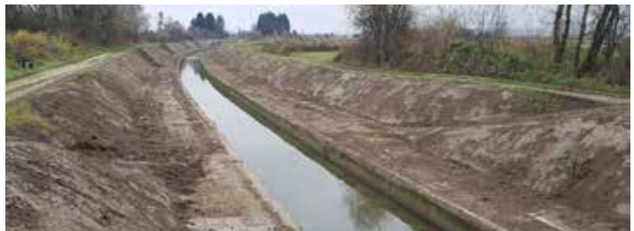
Po končanem čiščenju razbremenilni kanal Pšata znova izvaja svoj namen, v primeru visokih vodostajev ščiti pred poplavami naselja Mengeš, Topole in Loko