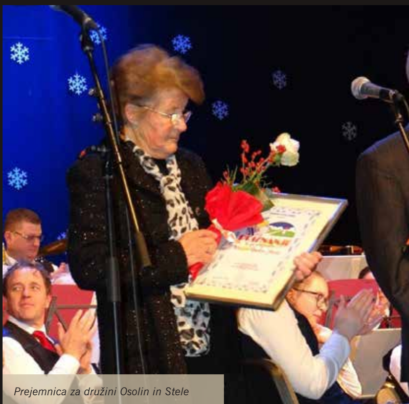
Prejemnica za družini Osolin in Stele