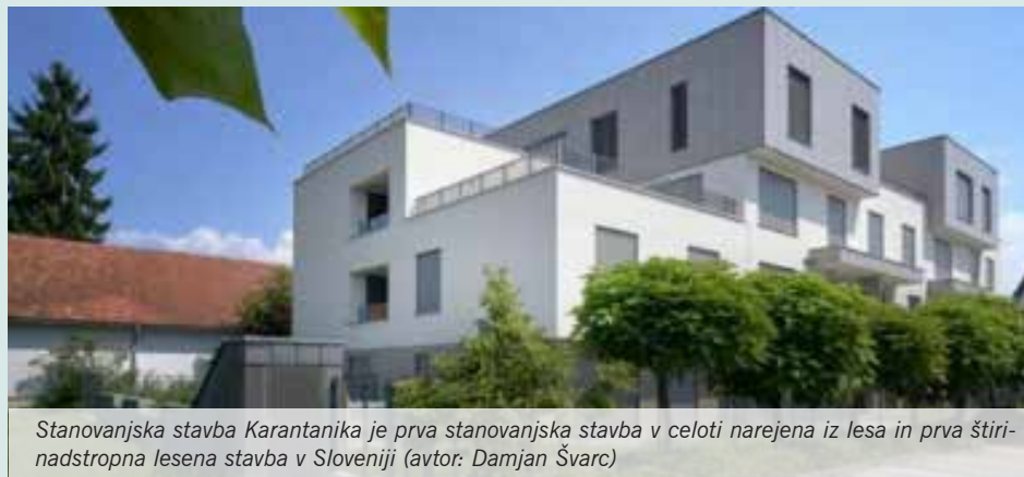
Stanovanjska stavba Karantanika je prva stanovanjska stavba v celoti narejena iz lesa in prva štiri-nadstropna lesena stavba v Sloveniji (avtor: Damjan Švarc)

Stanovanjska stavba Karantanika je rezultat arhitekturnega natečaja, ki je bila večkrat nagrajena in kot del mednarodne razstave izrednih primerov kulture lesene gradnje je bila predstavljena na različnih lokacijah v sedmih alpskih državah Evropske unije, poleg Slovenije še v Avstriji, Franciji, Italiji, Lihtenštajnu, Nemčiji in Švici. Stavbo so načrtovali v TRIA STUDIO, d. o. o., Mengeš, statiko je izvedlo podjetje CBD, d. o. o., Celje, gradnjo in gradbeni inženiring pa podjetje Alfa Natura, d. o. o., Domžale.