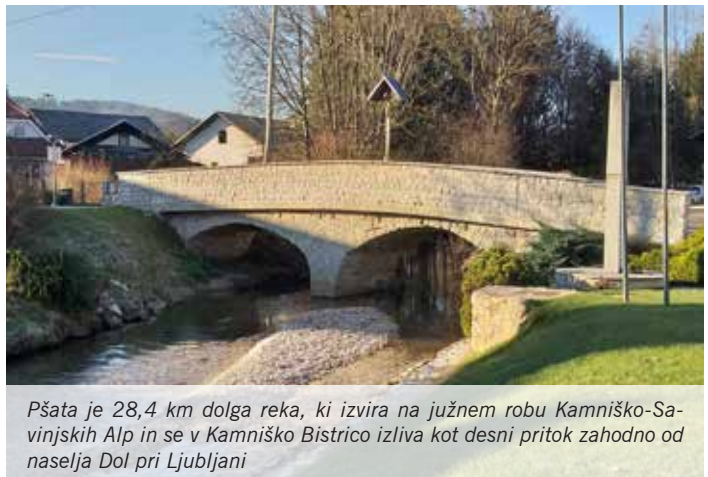
Pšata je 28,4 km dolga reka, ki izvira na južnem robu Kamniško-Savinjskih Alp in se v Kamniško Bistrico izliva kot desni pritok zahodno od naselja Dol pri Ljubljani