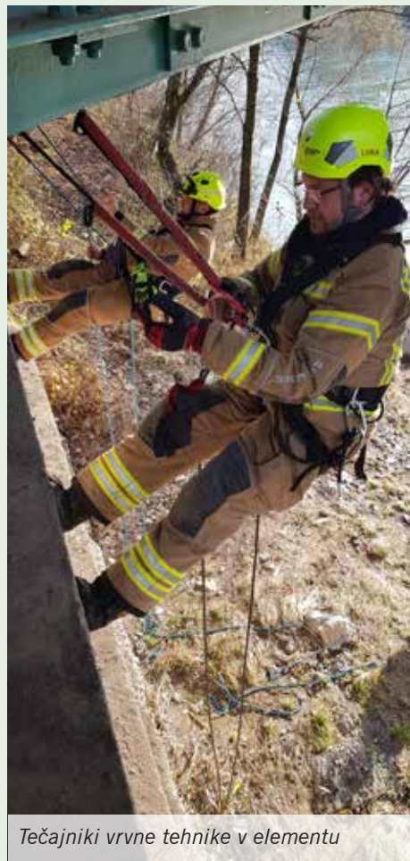
Tečajniki vrvene tehnike v elementu