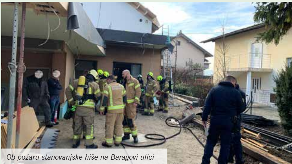
Ob požaru stanovanjske hiše na Baragovi ulici

Glede na vremenske razmere, ki niso prav nič zimske, razen občasnega spusta temperature pod ledišče, je tudi december minil kar mirno, vsaj kar zadeva intervencijske posege. Seveda pa delo društva tudi v teh mirnejših obdobjih leta ne zamre. Tu so namreč že priprave za letni pregled dela društva oz. redni letni občni zbor. Ta bo že 87. po vrsti in bo potekal zadnji petek v januarju 2020.