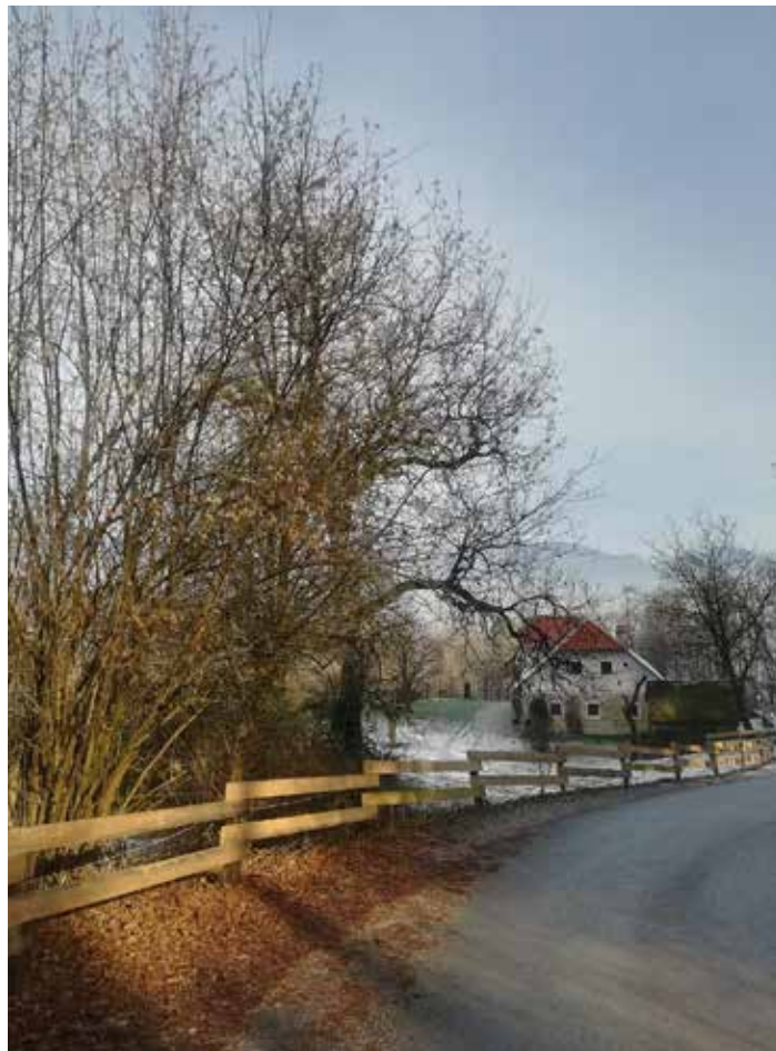
Maja, pobudnica FB skupine Mengeška 100krat, prisega bolj na jutranje sprehode, zato sem se morala prav potruditi, da sem med objavljenimi fotografijami našla eno malo bolj zimsko in dnevno.

Avgusta sta navdušila Maja in Franc, ki sta na dogodku K24 osvojila 50 km traso. Na nočni 10tki pa članice niso sodelovale samo