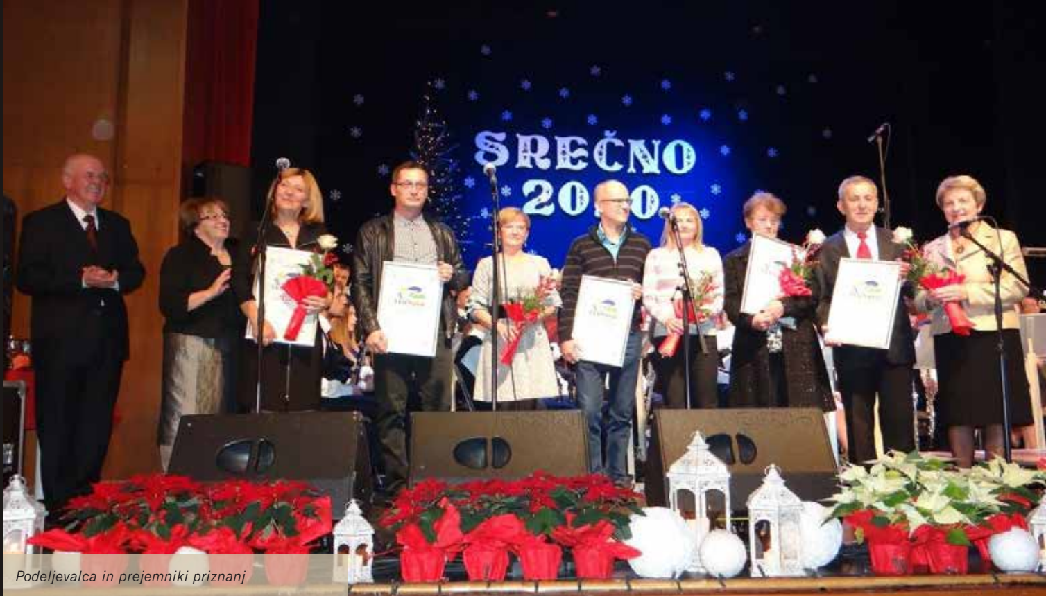
Podeljevalca in prejemniki priznanj