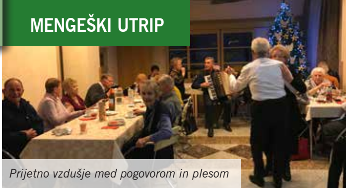
Prijetno vzdušje med pogovorom in plesom