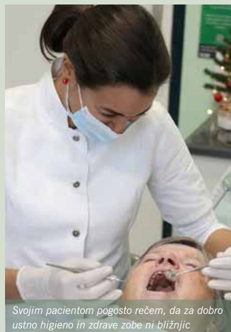
Svojim pacientom pogosto rečem, da za dobro ustno higieno in zdrave zobe ni bližnjic

Starejše paciente oziroma paciente, ki imajo protezo, bi želela opozoriti, da morajo vsako dan skrbeti zanjo in svojo ustno higieno. Prav tako za naravne zobe, če jih še imajo. Pri skrbi za protezo je najpomembnejše, da jo negujemo glede na zahteve materiala. Kot smo prej skrbeli za svoje zobe, je treba ohranjati rutino čiščenja pri protezah. Vsak večer naj jo umijejo s toplo vodo, zelo mehko ščetko in milnico (za roke), obstajajo tudi posebne tablete, namenjene prav protezam. Vsekakor ne uporabljamo za čiščenje protez zobne paste, ker je preveč abrajna.