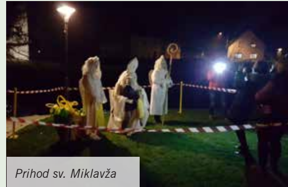
Prihod sv. Miklavža

V sredo, 5. decembra, so člani naše operativne enote skrbeli za varovanje in umirjanje prometa na prireditvi ob prihodu svetega Miklavža, ki jo je organiziralo Kulturno društvo Antona Lobode. Prireditev je bila na zelenici pri kamnitem mostu sredi vasi. Seveda so pomagali tudi angelčkom in Miklavžu paziti,