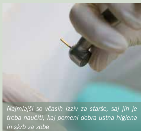
Najmlajši so včasih izziv za starše, saj jih je treba naučiti, kaj pomeni dobra ustna higiena in skrb za zobe

Opozorila bi rada, da noben nadomestek zoba (implantat, proteza ...) ne more nadomestiti občutka, ki ga nudi naraven zob pri žvečenju. Naravni zobje so nenadomestljivi! Zato je zelo pomembno, da jih zvečer in zjutraj redno ščetkamo ter nitkamo. Zmagovalni recept je ščetkanje 3 min zjutraj in zvečer, 1–2 min nitkanja zvečer in redne kontrole pri osebnem zobozdravniku. Pomembno je zavedanje, da smo za svoje ustno zdravje in zobe odgovorni sami, najlažje je reči »imam slabe zobe«, hkrati pa si ne vzeti časa za skrb in preventivo zobnih ter ustnih bolezni vsakodnevno v udobju lastne kopalnice. Ve-