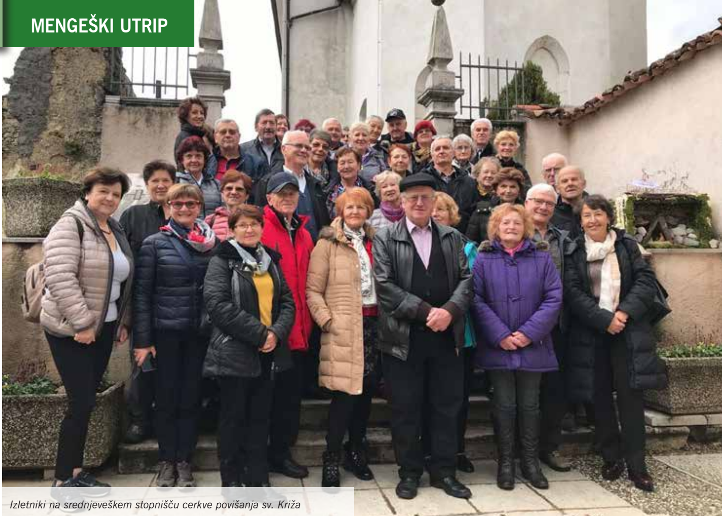
Izletniki na srednjeveškem stopnišču cerkve povišanja sv. Križa