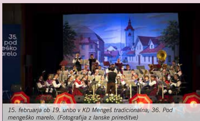
15. februarja ob 19. urico v KD Mengeš tradicionalna, 36. Pod menceško marelo. (Fotografija z lanske prireditve)