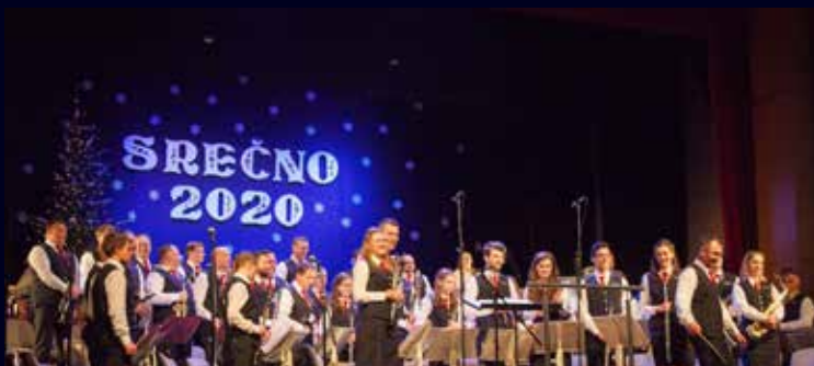
Godbenice in godbeniki so pripravili odlična božično-novoletna koncerta