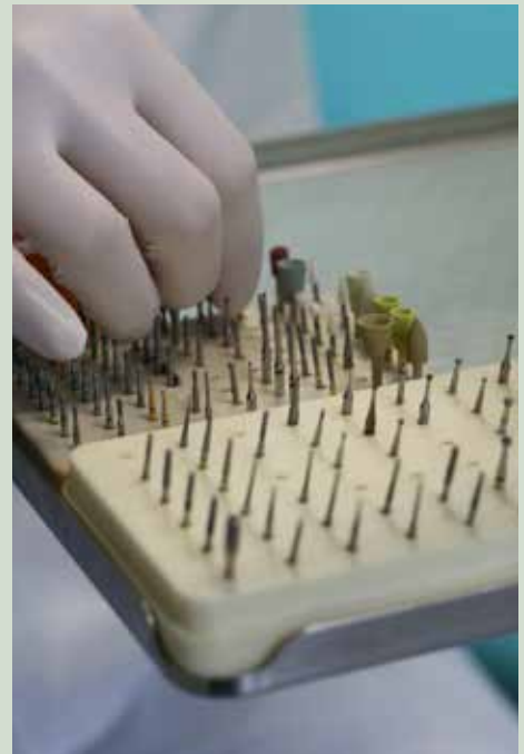
Pri starejših opažam, da je skrb za ustno higieno povezana tudi z njihovo motoriko, ki se seveda z leti slabša

Kot sem že omenila, je pomembno, da za naravne zobe ali nadomestke dnevno skrbi-