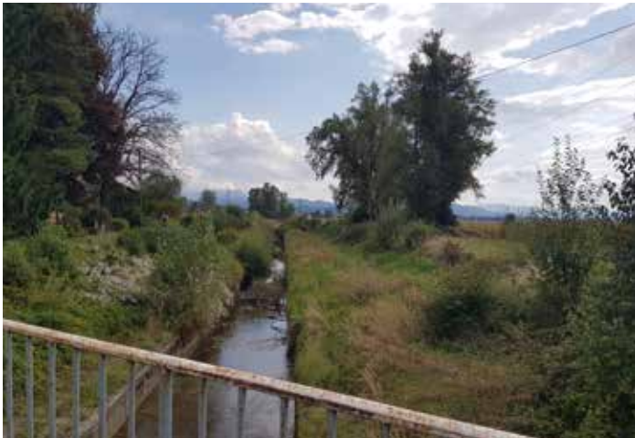
Pred začetkom del je pretočnost poleg naplavin močno zmanjševala tudi zaraščenost brežine

Razbremenilnik Pšate od mostu na Kolodvorski cesti pa do mostu na Jarški cesti je bil v letu 2019 očiščen naplavin in močnega zarastja. Z ureditvijo kanala in zagotovitvijo pretočnosti profila je bila znova zagotovljena poplavna varnost, ki jo je z izgradnjo zagotavljal razbremenilnik. Franc Jerič, župan Občine Mengeš, je pojasnil: »Občina je zaradi dolgotrajnih postopkov za ureditev voda na območju srednje Save aktivno pristopila k projektu čiščenja razbremenilnika kanala Pšate in za realizacijo zagotovila tudi del potrebnih sredstev v proračunu občine za leto 2019. Čiščenje razbremenilnika je bilo nujno, saj je bila pretočnost v kanalu močno zmanjšana.«