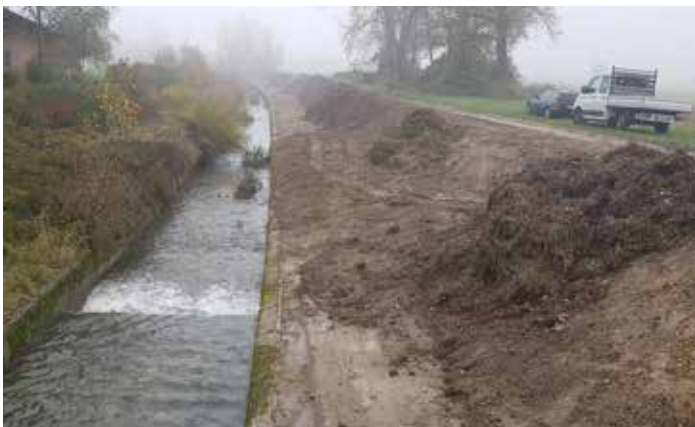
Naplavine so odstranili, jih odložili na razbremenilnik in nato odpeljali

Prav zato je Občina Mengeš z Ministrstvom za okolje in prostor v letu 2019 dosegla dogovor, da se brežina v letu 2019 očisti, tako naplavine kot zaraščenost. Občina je v ta namen v proračunu občine za leto 2019 rezervirala del potrebnih sredstev in tako še spodbudila državo k ureditvi območja. Dela je izvedel koncesionar Hidrotehnik, vodovarstveno podjetje, d. o. o., ki je dela začel v mesecu oktobru in jih zaključil v mesecu decembru.