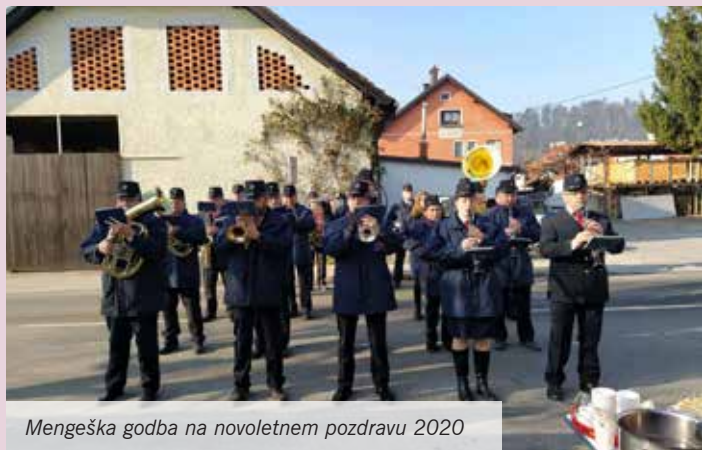
Mengeška godba na novoletnem pozdravu 2020

Mengeška godba je na novega leta dan tradicionalno korakala po menceških ulicah ter občankam in občanom Mengeša voščila z glasbeno čestitko in udarnimi koračnicami.