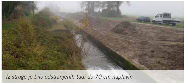
Iz struge je bilo odstranjenih tudi do 70 cm naplavin

Čiščenje razbremenilnega kanala Pšate je potekalo od mostu na Jarški cesti v Jaršah do mostu na Kolodvorski cesti v Mengšu. Skupaj je bilo za izboljšanje poplavne varnosti naselij ob vodotoku Pšata odstranjenih naplavin in odstranjena zaraščenost z brežin v dolžini 1,5 km. Naplavine so odstranili, jih odložili na rob razbremenilnika in nato odpeljali. Vsi mimoidoči so lahko opazili, da je bilo naplavin izredno veliko. Sedaj je kanal znova urejen, kar zagotavlja tudi potrebno pretočnost profila in potrebno poplavno varnost naselij v bližini.