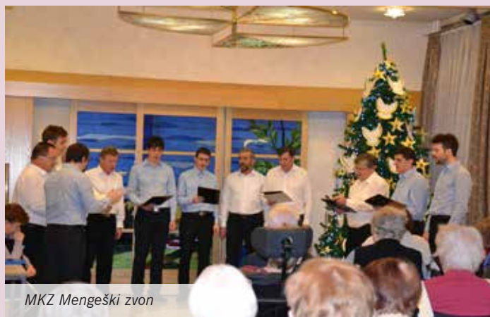
MKZ Mengeški zvon

V decembru nastopi čas adventa, zato smo se člani Mengeškega zvona v obeh sestavih odločili, da pripravimo koncert adventnih pesmi, ki so morda malo manj poznane in izvajane, izražajo pa hotenja po pričakovanju Odrešenika in imajo v slovenski liturgični pesmi prav posebno mesto.