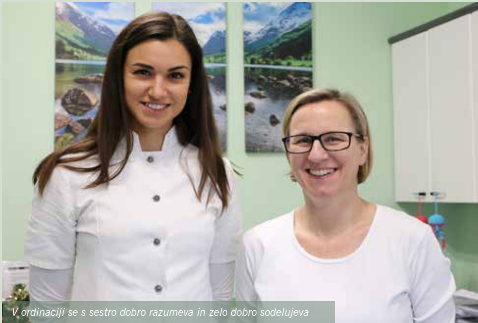
V ordinaciji se s sestro dobro razumeva in zelo dobro sodelujeva

zivna (agresivna) za material, iz katerega je narejena proteza.