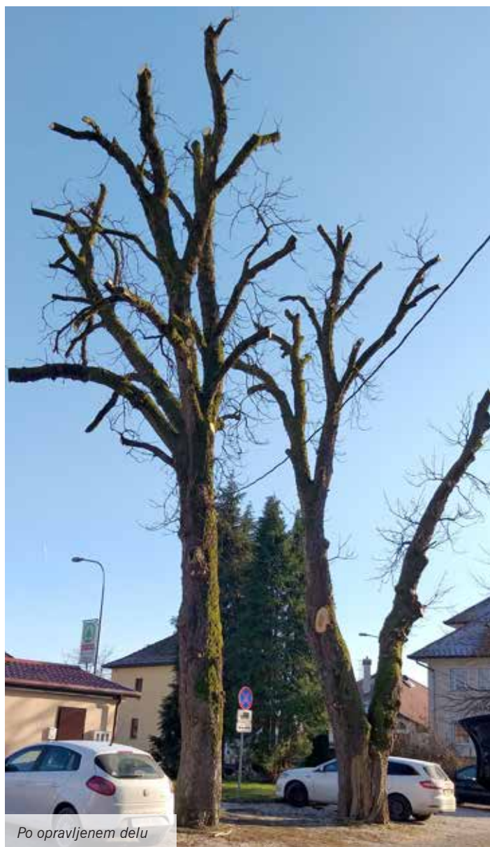
Po opravljenem delu

stiti suhih vej in razredčiti preveč goste veje na obodu krošnje. Pri obeh drevesih je bil med ukrepe vključen tudi predlog, da se razmisli o prepovedi parkiranja avtomobilov neposredno pod krošnjo dreves, ker to vpliva na koreninski sistem, zbitost tal, možnost poškodb koreninskega vratu in debla.