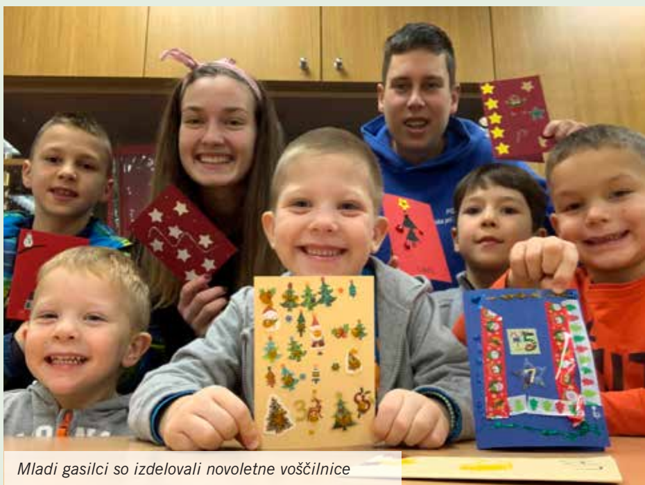
Mladi gasilci so izdelovali novoletne voščilnice