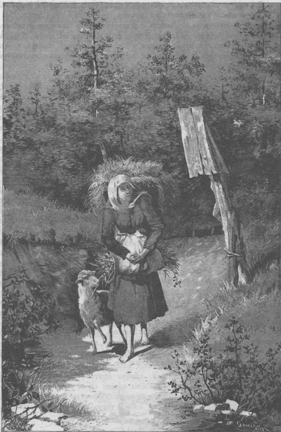
pastirja Vencoslav, sestra: žival ne sme stradati.