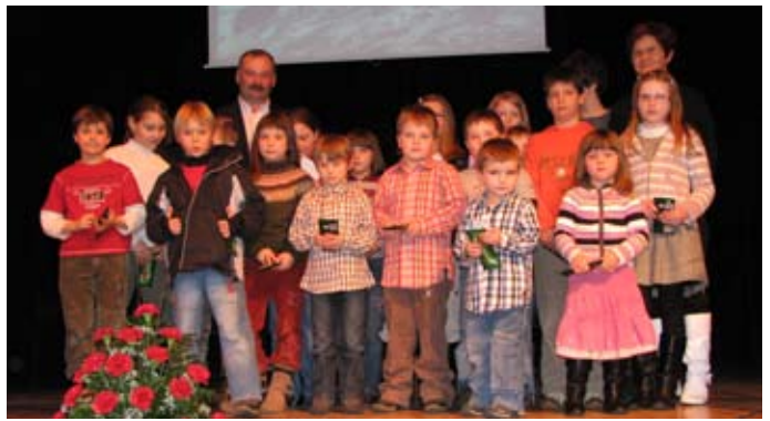
Planinski naraščaj prejel priznanja