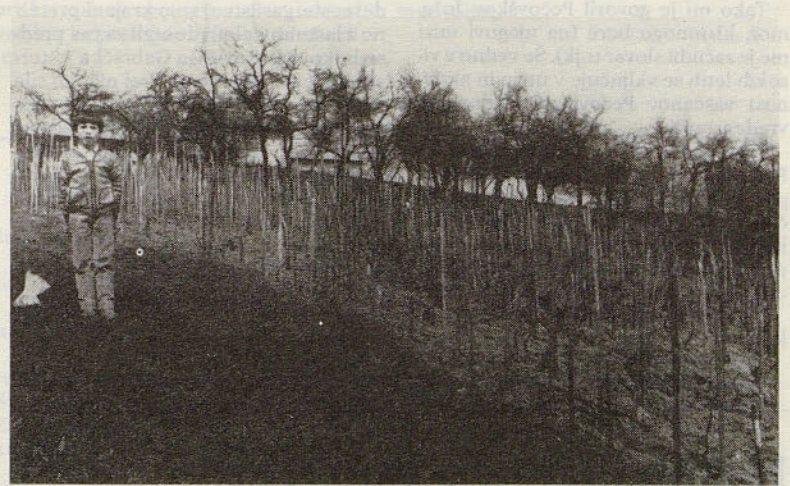
Sitarjev vinograd: pod njim je bilo nekoč pokopališče starih Rimljanov.

»V rudniku »Perhpau« sem delal od leta 1922 do 1936 pri matičnem rovu