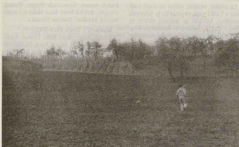
Na tem prostoru so v Laški vasi našli najstarejše rimske izkopenine na slovenskih tleh.

ju) je odneslo uho. Takrat je delalo v rudniku okoli 100 ljudi (1923–1924). Pri domačiji Flis v Laški vasi je bila separacija premoga. S konji in volmi smo premog nato odvažali štorskim kovačem in pudlarjem ob Bojanskem grabnu. Da, bili so to težki časi, kapitalisti so si nagrabili denarja, mi pa revme za transport ... Prosim vas, zapišite to: sedaj ljudje preveč radi kritizirajo, ne vedo, kako smo živeli včasih. Delali smo do starčevskih let ali celo do smrti. Tiste milostne solde, ki smo jih dobili za „plačo“, smo prvo gledali in se tresli zanje, nato pa od razočaranja ali obupa večkrat zapili ...»