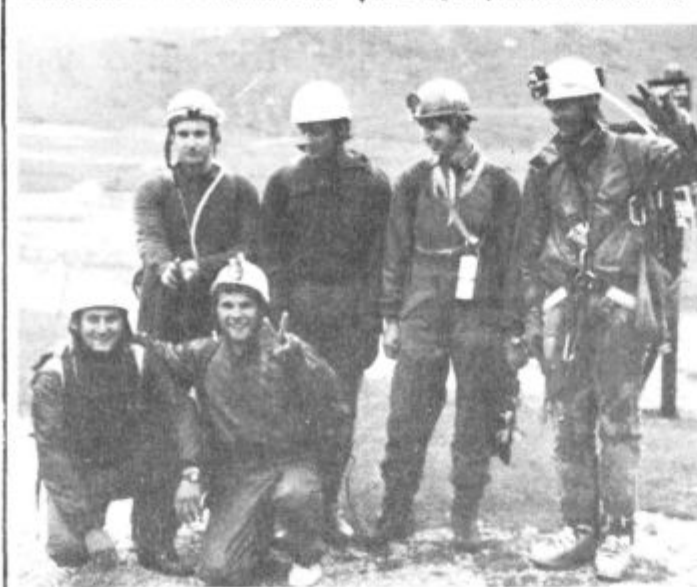
Raziskovalna skupina jamarjev na Korošici

klubi iz Domžal, Kamnika in Prebolda. Skupaj so našli in raziskali preko 100 novih jam, od tega