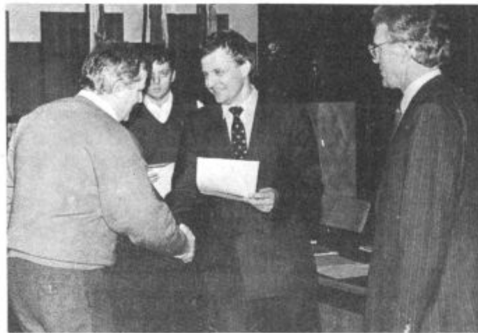
Najboljši so prejeli priznanja

ne meče polen pod noge, saj taktat gotovo nismo več inovativni.