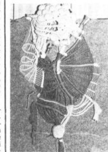
Za tole voženje je porabil kar poldrugi kilometer vrvi