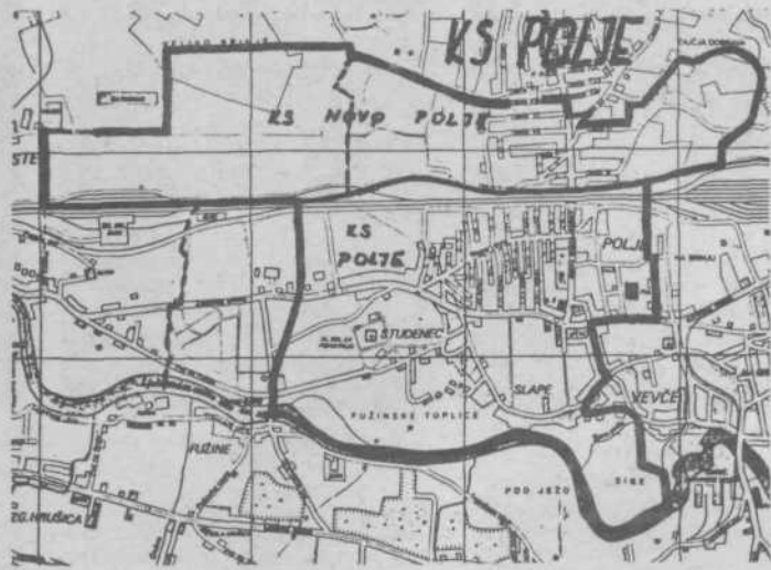
KS Polje in KS Novo Polje