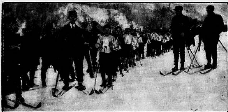
Šolska mladina pri smučarski tekmi v Kranjski gori.

ehniško vodstvo JSS skuša zanesti med sokolsko članstvo tudi zanimanje za one panoge telovadbe, ki so neodvisne od telovadnice, to so panoge lahke atletike, plavanje in pozimi smučanje. Kakor vse kaže, ima propaganda za smučanje precej velik uspeh, ker gre vzporedno s sokolskim prizadevanjem tudi delo sportnih organizacij, dalje dnevno časopisje in končno ima tokrat tudi moda svoj blagodejni učinek. Pa tudi zabavna stran smučanja pritegne marsikoga, da se poda v čisti gorski zrak in da uživa prijetnosti lepih zimskih dni v krasni naravi. Smučanje bo najbrže postalo glavna panoga telesnih vaj pozimi ne samo za člane ampak tudi za članice, za oboji naraščaj in celo za deco. Seveda bo mogoče to koristno panogo gojiti le v krajih, kjer so za to ugodne terenske in vremenske prilike.