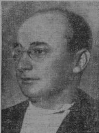
L. Beria, novi šef sovjetske tajne policije ali Čeke. Njegov prednik je bil »prestavljen« na drugo mesto