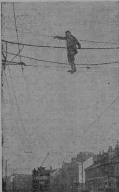
Novodobni elektromonter na Angleškem