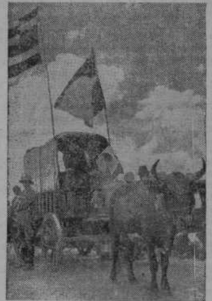
Stoletnica naselitve Burov v južni Afriki. Slika nam kaže prvi voz burških kolonistov.

»Javljam pokorno, gospod ritmojster, prosti čas svetega večera sem porabil v to, da poučujem orožnike o igrah, katere so strogo prepovedane po zakonu in jih oni