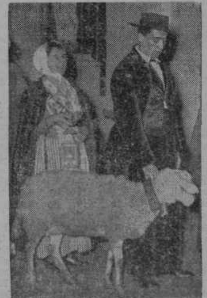
V nekaterih krajih na Francoskem darujejo pastirji cerkvam na božični praznik ovce.