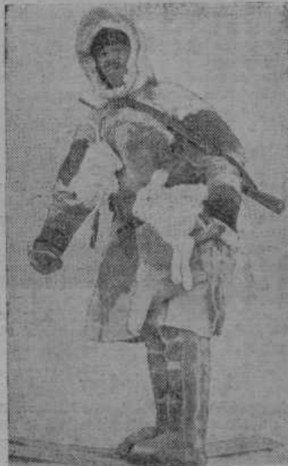
Tako se mora oblačiti v sedanji zimi ruski lovec

bili nadzorno oblast na sveto noč, ko so vsi službe prosti in bo to priliko uporabil predstojnik za praznenje njihovih skrčenih žepov z goljufivo igro.