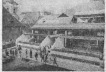
PRAVLJIČNI SVET POD GRADOM