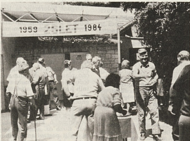
Ob prihodu v Pineto so goste pričakale dekleta in žene s rdečimi nageljni in rožmarinom, kruhom in soljo, pa tudi »vejica« ni manjkala.