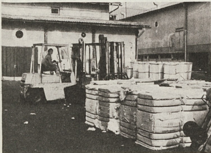
Vsakodnevni pogled na razkladalno rampo ob industrijskem tiru.