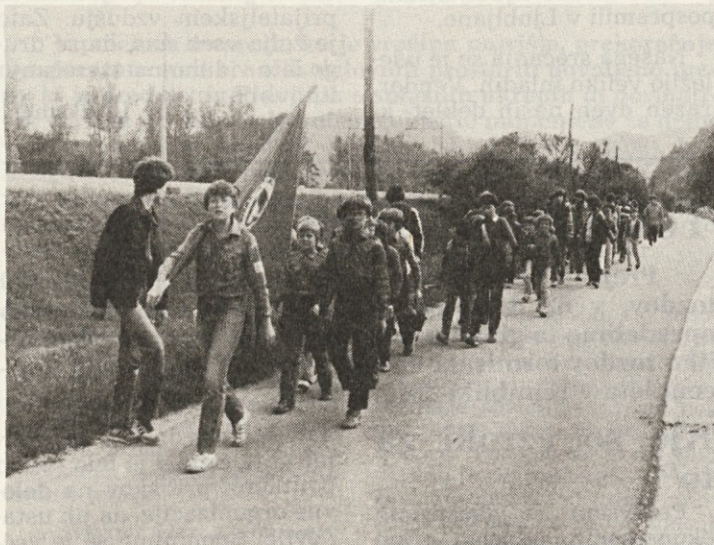
Pohod naših tabornikov v Ponoviče.

Delo odreda Srebrnih pajkov se na pomlad preseli iz zaprtih prostorov, in stekle so tudi vse planirane akcije.