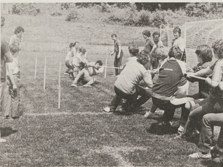
Mladinci iz Dekorativne so se z nami pomerili tudi v vlečenju vrvi.