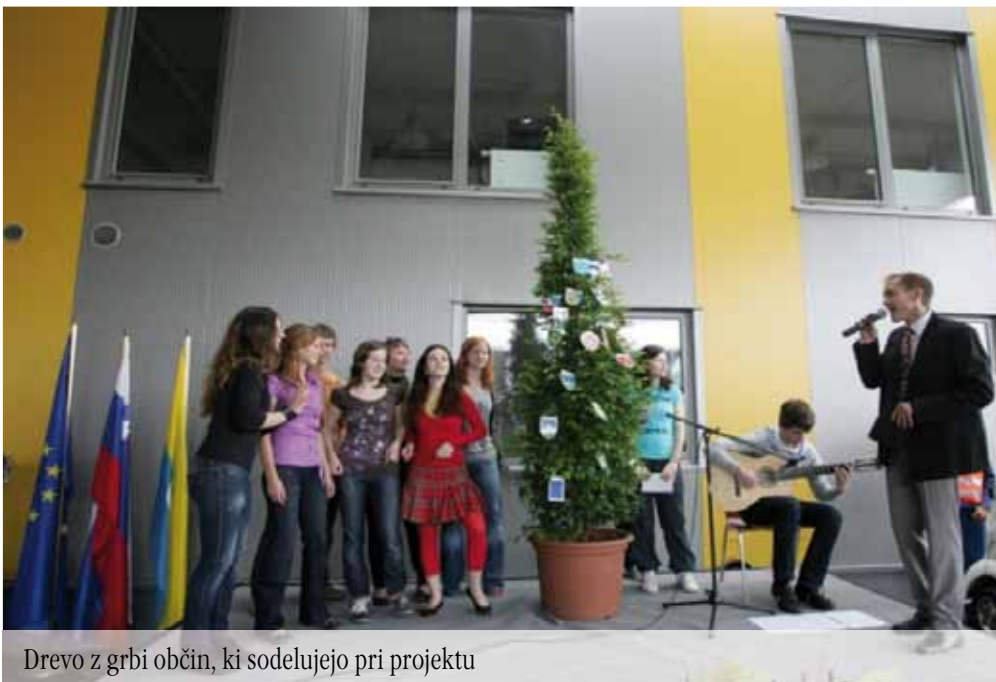
Drevo z grbi občin, ki sodelujejo pri projektu

Sredi meseca maja, natančneje štirinajstega, se je v popoldanskih urah zgodila otvoritev 2. faze Centra za ravnanje z odpadki Celje - mehanska biološka in termična obdelava komunalnih odpadkov v Bukovžlaku. Investitor projekta je mestna občina Celje, skupaj pa je v projekt vključenih 24 občin Savinjske regije. Izvedbo sofinancirata še Evropska unija iz kohezijskega sklada in Republika Slovenija. Vrednost investicije pa presega 11 mio EUR. Kohezijski evropski sklad je prispeval skoraj 60 % investicije, lokalne skupnosti 27 %, preostanek pa Republika Slovenija.