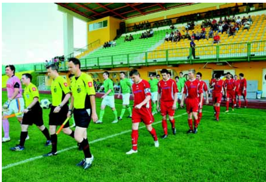
Kovinarji v Dravogradu (prečudovit športni objekt, žal za nas samo sanje...)