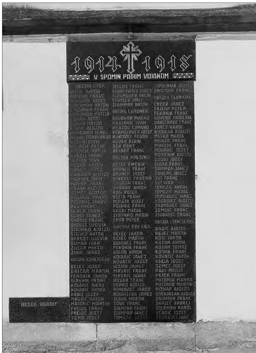
Spominsko obeležje padlim v prvi svetovni vojni na severni steni prezbiterija župnijske cerkve v Ljutomeru.

dokumenti (sezname) pa vendarle še hranijo spomin nanje. Med vojno in neposredno po njej so bili spomini na te osebe še precej sveži in domačini so, skupaj s civilnimi, cerkvenimi in vojaškimi oblastmi, skušali s potrebno pieteto skrbeti za te grobove umrlih vojakov in vojnih ujetnikov, ki so bili pokopani po številnih krajih monarhije. 128 Maja 1919 so časopisi poročali, da je bilo samo v Ljubljani 6540 vojaških grobov. Od tega je bilo 170 takšnih, ki so potrebovali popravilo. 129 Deželna vlada je že 19. novembra 1919 izdala ukaz, naj vse orožniške postaje na Kranjskem in Štajerskem o morebitnih vojaških grobovih na