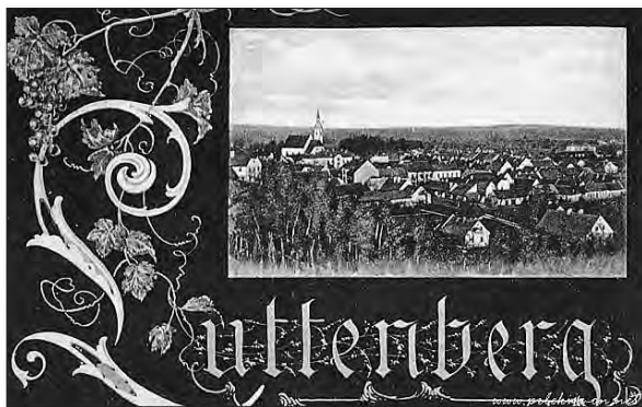
Razglednica Ljutomera (hrani: DZ oddelek Splošne knjižnice Ljutomer).

evangeličanov je bilo le 8, še manj je bilo judov (5) in predstavnikov drugih veroizpovedi (1). V sodnem okraju so delovale štiri župnije: Mala Nedelja, Veržej, Križevci in Ljutomer. 11