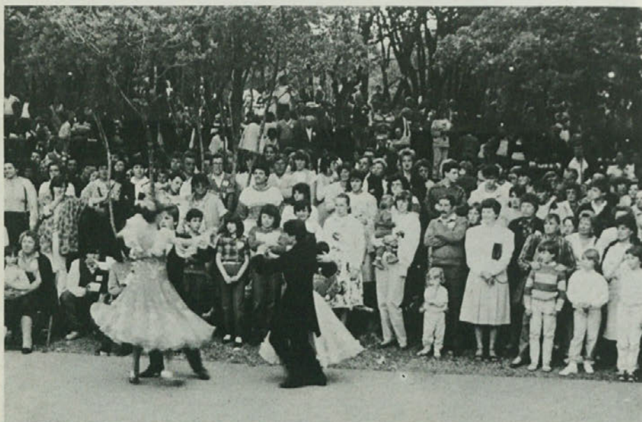
V Trnovci so konec prejšnjega tedna organizirali četrto vaško šagro z bogatim programom; med drugim je nastopala tudi mladinska plesna skupina Isontine iz Gorice, ki je žela velik uspeh.

Fortuna se je pogovarjal z znancem, ki ga ne imenuje, kar pomeni, da si ga je najbrž izmislil. Poleg tega pa je pri-