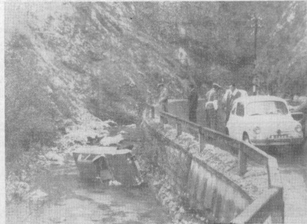
V sredo, 1. novembra dopoldne je KAREL RABUZA pripeljal osebni avtomobil MB 260-03 iz Slovenj Gradca proti Velenju. Na ovinku ga je zaradi mokre ceste zaneslo in se je z avtomobilom zvrnil v Pako. Na fotografiji: prevrnjeni avtomobil v Paki.

Krilo s telovnikom je primereno za službo, šolo in krajše sprehode. Pod telovnik spadajo različne bluzice, ki postavijo šele piko na i.