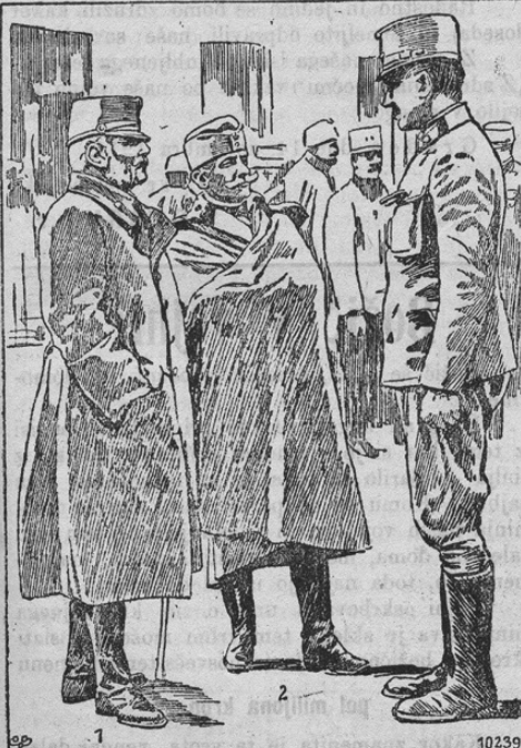
Der österreichische Oberkommandierende Erzherzog Friedrich I. und Generalstabschef Conrad v. Hötzendorf im Hauptquartier.

Kakor, znano je vrhovni poveljnik avstro-ogrske armade nadvojvoda Friderik. Prinašamo danes njegovo sliko (1). Poleg njega stoji