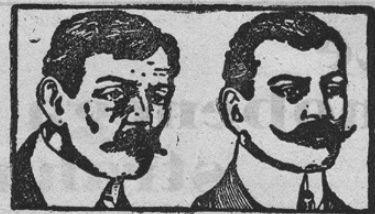
Pred rabo Po rabi

Ekspozitna hiša „Perfekt“, Dunaj, VII., Neustiftgasse 137/18.