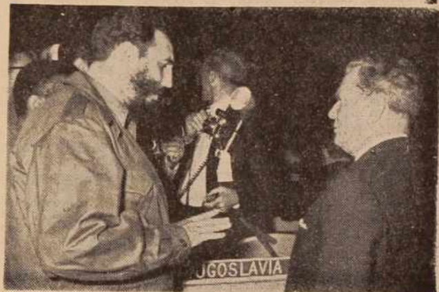
ENO IZMED SREČANJ — Predsednik Tito in kubanski premier Castro

New York — Predsednik Tito se je v zadnjih dneh sestel v svoji rezidenci, v OZN ali rezidencah tujih delegacij s številnimi uglednimi državniki. Omenimo naj samo srečanje s predsednikom Eisenhowerjem, premierom Castro, premierom Nehrujem, predsednikom Naserjem, princem Sihanukom iz Kambodže ter vodjem etiopske, afganistanske in alžirske delegacije. Na teh sestankih so obravnavali trenutni mednarodni položaj in vprašanja, ki jih bo načela Generalna skupščina OZN.