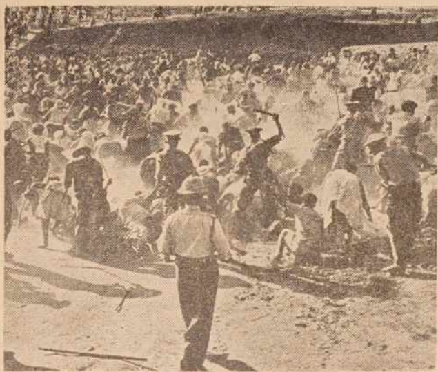
Razidem v praksi — Južnoafriška policija pretepa domačine

večno preklestvo, druge pa za rajsko blaženstvo. Eni zato služijo in delajo, drugi pa vladajo. »Smo daleč od tega, da bi bog zahteval enakost,« je govoril Malan. Če bi bog hotel, da bi bili črnci enako-