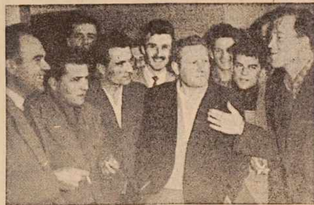
Slušatelji med pomenkom

Novoizvoljeni 9-članski komite bo imel glede na potrebe v naših kmetijskih zadrugah, ki zahtevajo predvsem vsestransko razgledane in pravilno usmerjene kmetijske strokovnjake, do konca študija še