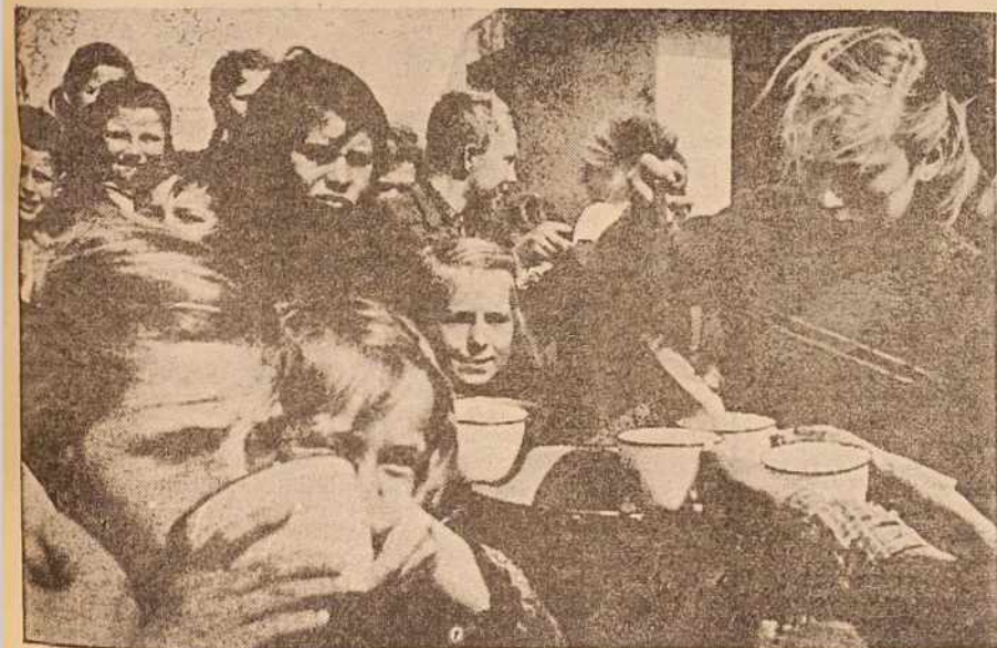
Otroci pri malici