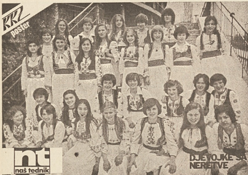
Za njihove „navijače“ je izdala KKZ poseben poster

V okviru turneje po Avstriji in ob priliki nacionalnega praznika SFRJ se je ob povratku v domovino ustavila pri nas skupina deklet — „Devojke sa Neretve“ iz bosanskega mesta Konjic. Na Koroškem so nastopili v dveh krajih, v Borovljah in Pliberku. Organizacijo gostovanja na Koroškem je prevzela Krščanska kulturna zveza, v Pliberku pa je bil soprireditelj še MPZ Podjuna, ki je poskrbel zato, da so Pliberčani po dolgem spet napolnili do zadnjega kota dvorano pri Schwartzlnu, zamudniki pa sploh niso mogli več v dvorano.