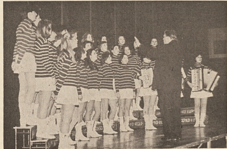
Tudi v Borovljah so navdušile publiko

„Augen- und Ohrenweide“, je spričo nasmejanih mladih dekliških obrazov ugotovil g. ravnatelj