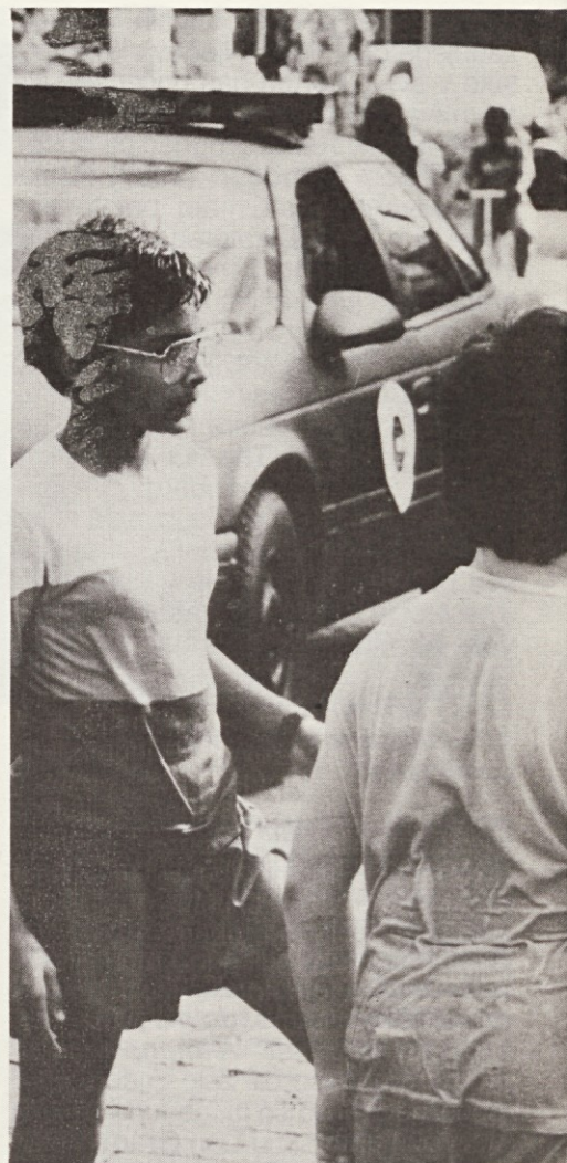
... IN KOT NASLOVNI JUNAK FILMA ROBOCOP 2 IRVINA KERSHNERJA

32 Moram reči, da mi je povsem tuj njegov satanizem, kakor tudi vsi sodobni elementi zgodbe, denimo crack in podobne zadeve... Tako kot v stripu tudi tu za številne epizodne junake sploh ne veš, od kod so se vzeli. Najboljši prizor celega filma - ko kriminalci razbijajo Robocopa - je razmesarila cenzura!