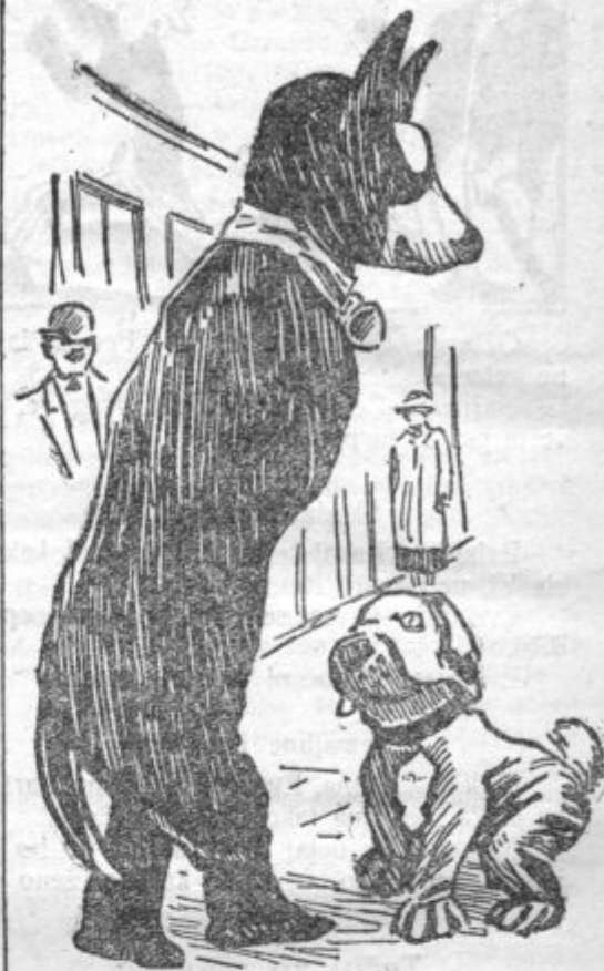
reklamne figure živih «psov.»

Zanimiva je na razstavi tudi reklama za razna podjetja. Naša slika predstavlja