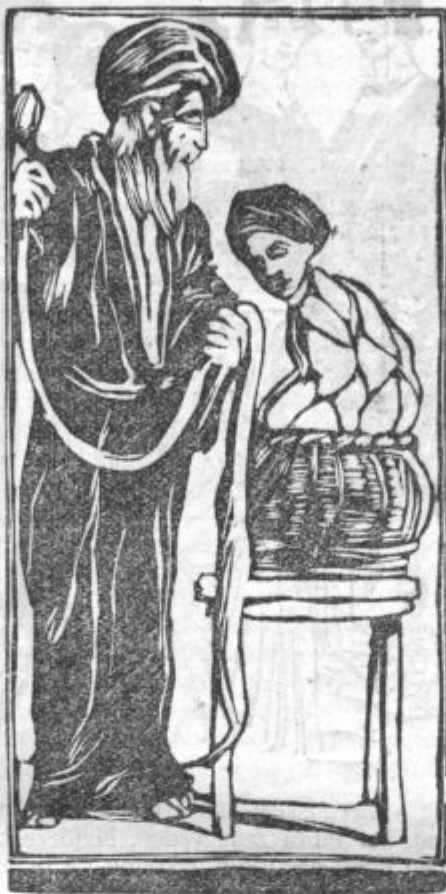
Indijski fakir Avihali,

bogastvo, kulturo in posebnost velike britanske države ter njenih kolonij, smo nedavno že pisali. Na razstavi pa je vrhu tega poskrbljeno tudi za razno zabavo.