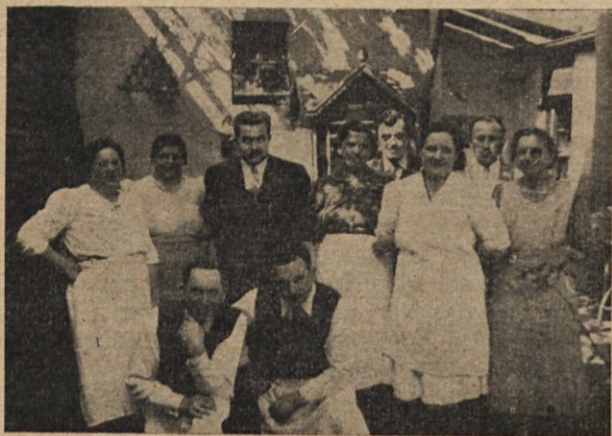
Obrazi iz Avellanede.

Konečno je bilo določeno, da se naslednji sestanek vrši 1. novembra ob 15 uri v šoli ul. Paz Soldán 4924 na Paternalu, od koder je prav blizu na Čakarito, kamor bodo vse vdeležanke lahko stopile na žalno slovesnost ob 17 uri.