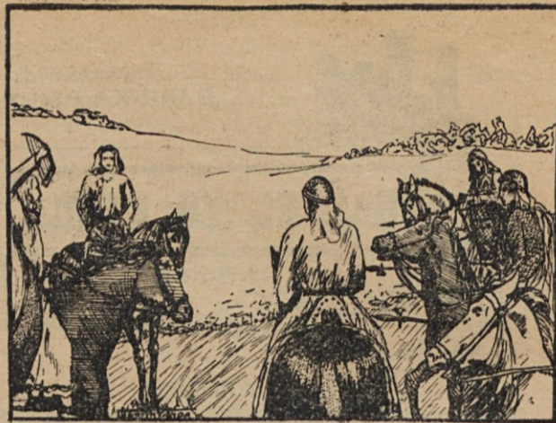
¡Paz! ¡Paz! — gritaba el músico agitando la lira...

Largaron los caballos al galope con foga juvenil. Muy pronto desapareció la distancia que mediaba entre ellos y el comerciante.