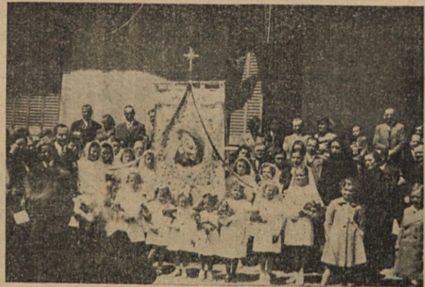
Okrog avežanedske zastave.

Zbrale smo se z namenom pogovoriti se o možnosti, kako si ustanoviti organizacijo, katere namen bi bil predvsem družabnost slovenskih deklet, živečih po raznih krajih tega ogromnega mesta. Ta ali ona poreče: Čemu nove organizacije, ko imamo že preveč raznih društev. To je res. Ali dekliške organizacije potrebne slovenskemu dekletu v tej deželi in še predvsem v tem ogromnem mestu, do sedaj nimamo še. Nekatere ste