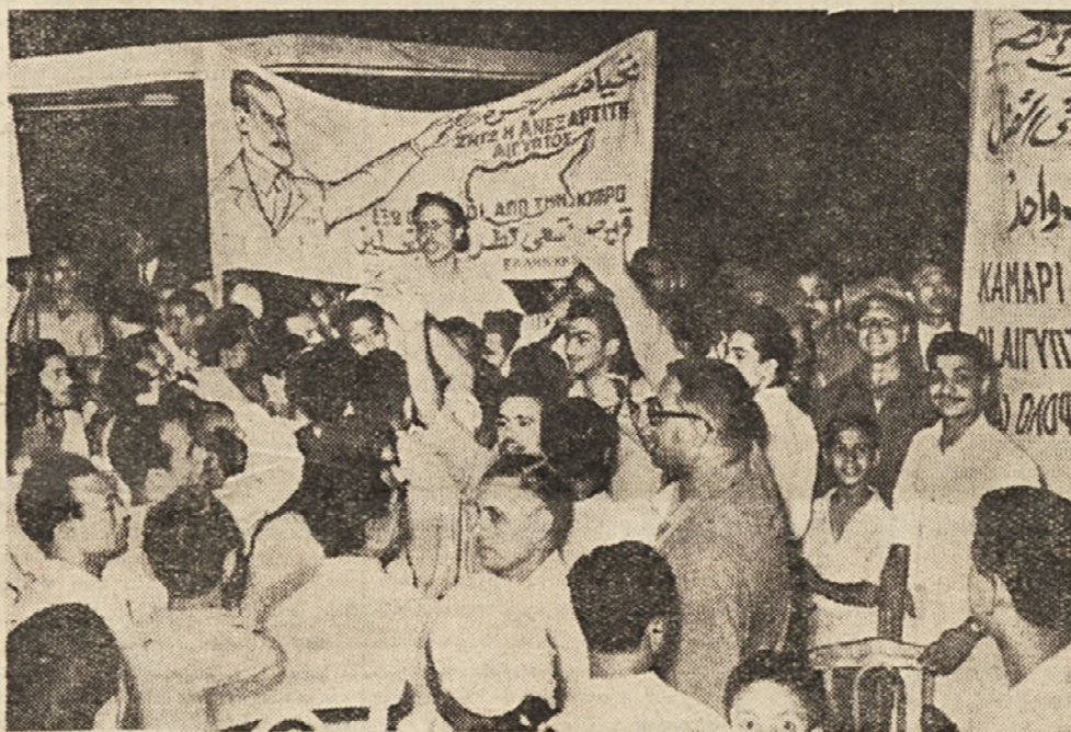
Na sliki: manifestacija egiptovskih visokošolcev po nacionalizaciji družbe za Sueski prekop. V trenutku, ko se je Egipt znašel pred grožnjami V. Britanije in Francije, se je v deželi skovala ljudska enotnost, ki je najbolj odgovor na poskuse, da bi se s posegi od zunaj omajala odločitev vlade Z Egiptom se je od 26. julija, t. j. dneva nacionalizacije, znašel ves arabski svet, ki ga s simpatijo podpirajo vse miroljubne države.